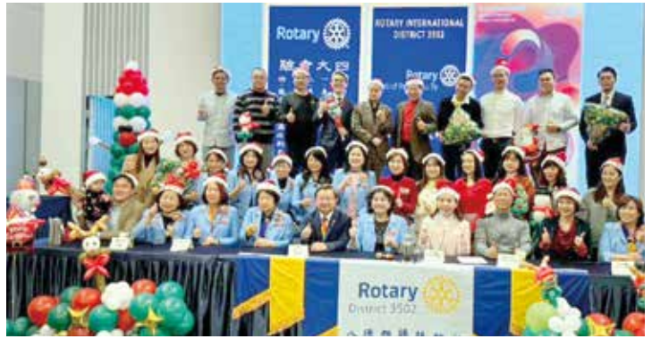
12月25日桃園儷德社創社籌備會