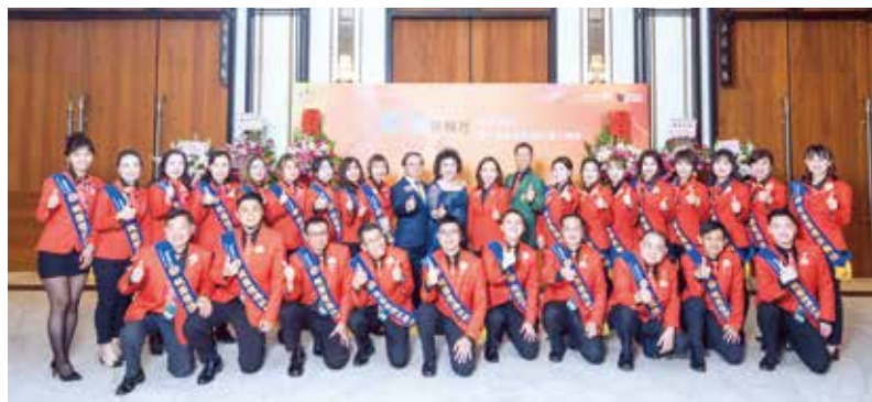
本社全體社友合影