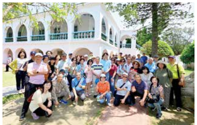
社友與寶眷們在充滿歷史感的「德記洋行」合影