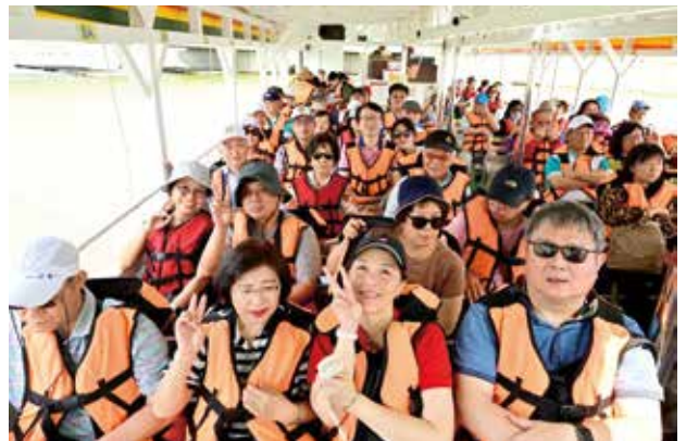
社友與寶眷們搭乘膠筏遊潟湖