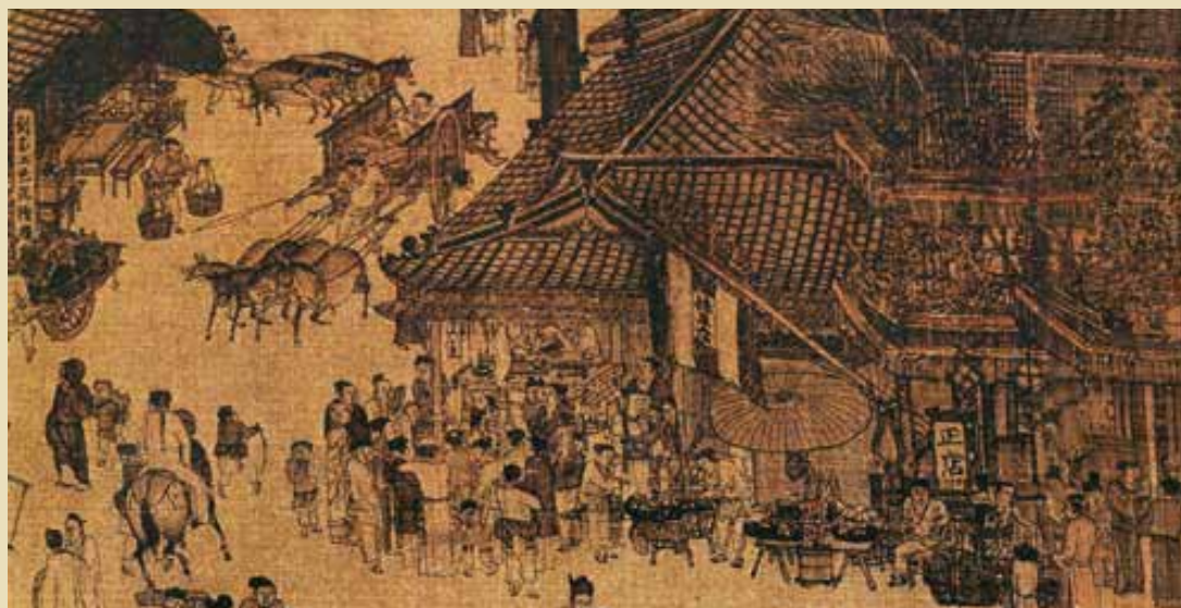
宋張擇端清明上河圖所繪京城正店