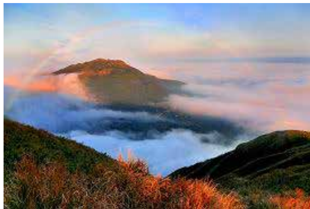
陽明山國家公園七星山