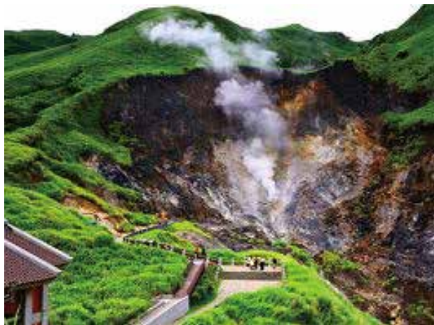
小油坑之美

屬安山岩。火山外型多為錐狀或鐘狀火山體，其火山地形包括火山口、火山口湖與爆裂口等構成台灣北部獨特的地質地形景觀。整個大屯火山群可以分為幾個獨立的亞群，其中最主要者包括：