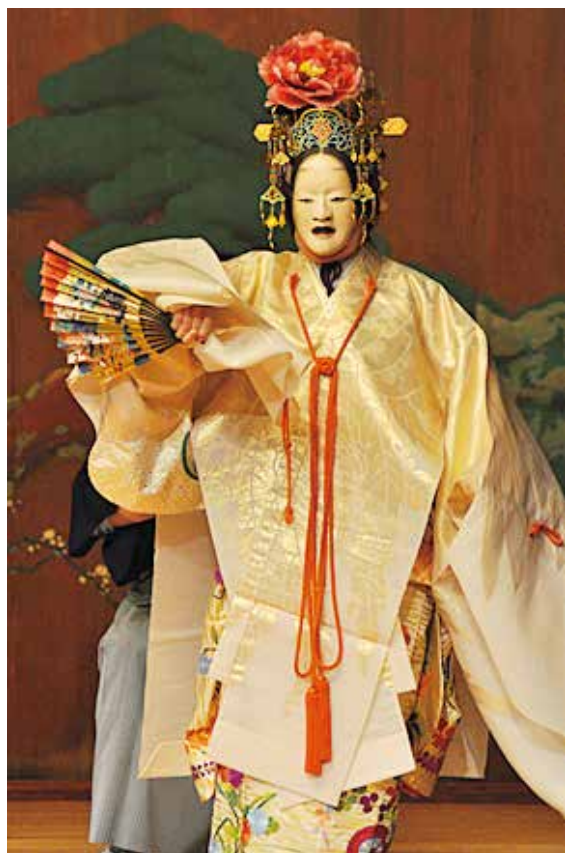
↑能劇為日本最古老的傳統藝能之一，充滿著一股空寂哀婉的氣息，將日本美學中的幽玄體現得淋漓盡致

「幽玄」是從人心出發的表達，是呈現在平安時期的和歌之中的貴族的修養，也成為了和歌的核心。當時權傾一時的藤原家族，就出現了好幾位對「幽玄」及和歌很有研究的學者，其中一位是藤原公任（966年-1041年）他認為和歌中最佳的「幽玄」