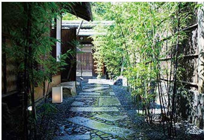
↑庭園中的綠竹營造了幽玄的氛圍

記得有一次到直島，在島上的藝術村中，有一幢由安藤忠雄負責設計裝置藝術的房子，屋子內甚麼都沒有，進去後是一片漆黑，要等眼睛慢慢適應了後才能看到微弱的光線，安藤忠雄說，若人生要追求「光」，先要認真凝視眼前名為「影」的苦難現實。日