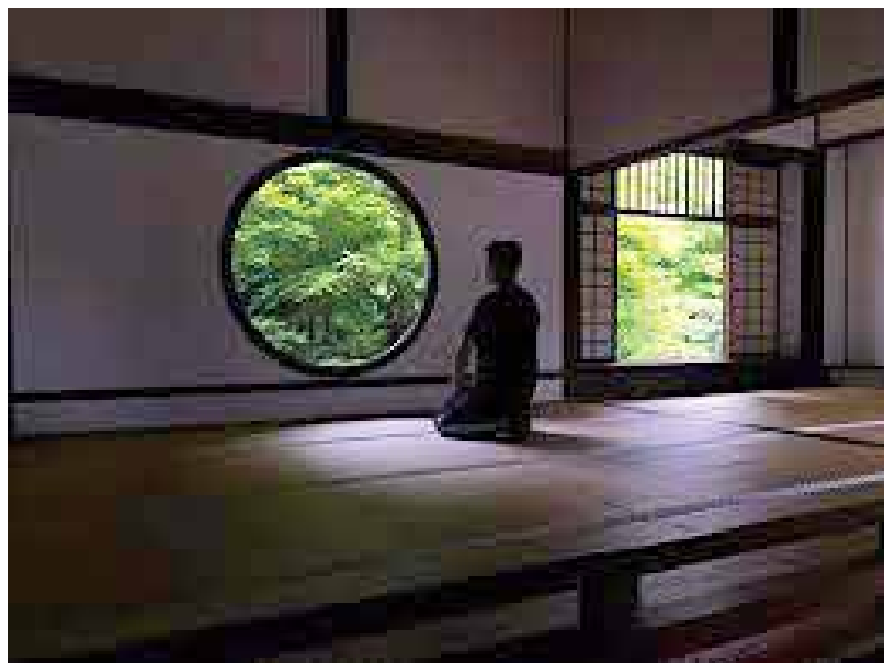
↑空間中的陰翳光效造出了幽玄的感覺

本的和室布置、建築設計、攝影、畫作…等，都非常重視陰影，亦即光線照不到的陰翳，那是一種靜謐、沉澱的氛圍，能帶給人一種孤