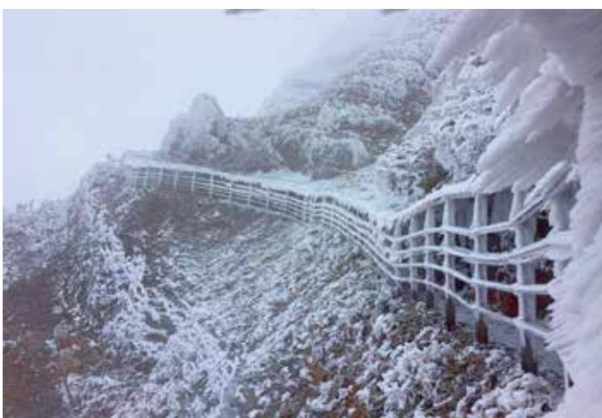
玉山冬雪——玉山國家公園

在整個園區中最受登山旅客青睞的排雲山莊位於玉山主峰下，此山莊建於 1943 年，原為日治時期的警察駐在所，戰後由林務局接管後重新整建，而成為登上玉山頂峰前最主要的休憩處。