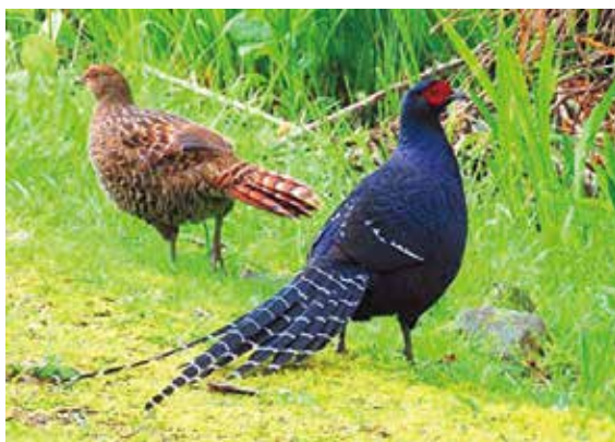
玉山帝雉是國家第二級保育類野生動物——大紀元

玉山國家公園園區擁有台灣半數以上的原生植物，其中哺乳動物約 65 種，包括長鬃山羊、黑熊等台灣特有種；鳥類約 233 種，包括帝雉、藍腹鷓、冠羽畫眉等台灣特有種；228 種的蝴蝶，約占台灣總數之半；此外並有冰河期的子遺生物、具有學術價值的兩棲類——台灣山椒魚及楚南氏山椒魚等。