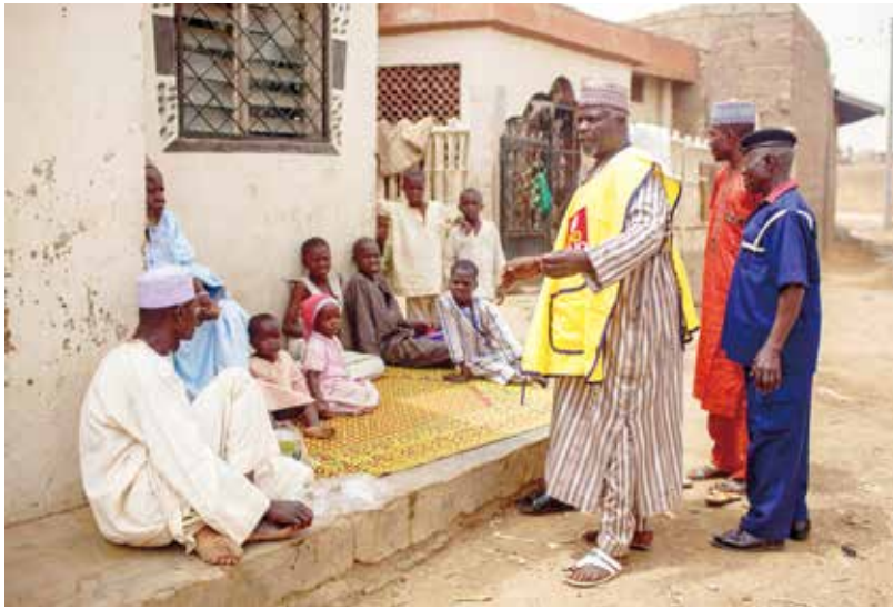
奈及利亞的扶輪成員與政府領導人一起宣導，並教育大眾消除一直以來關於疫苗安全性問題的誤傳。