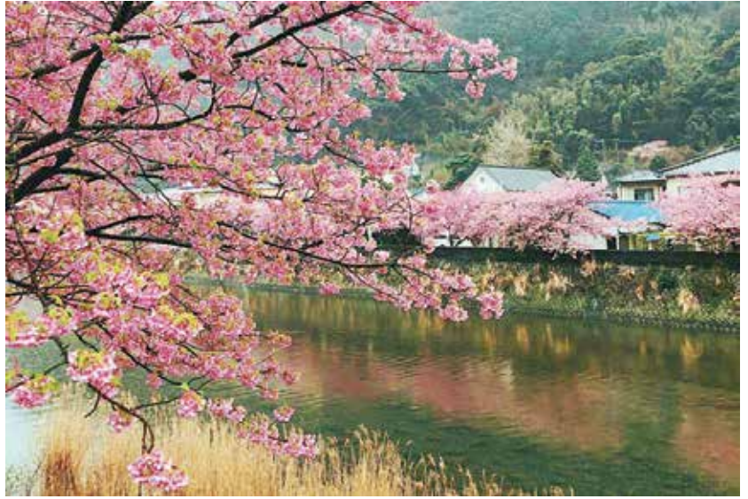
↑ 櫻花落下有物哀之美

貴族仕女們講述的故事而寫成書面的文學，「源氏物語」對日本文化的影響，一是寫實精神，其二就是「物哀」Mono Aware。