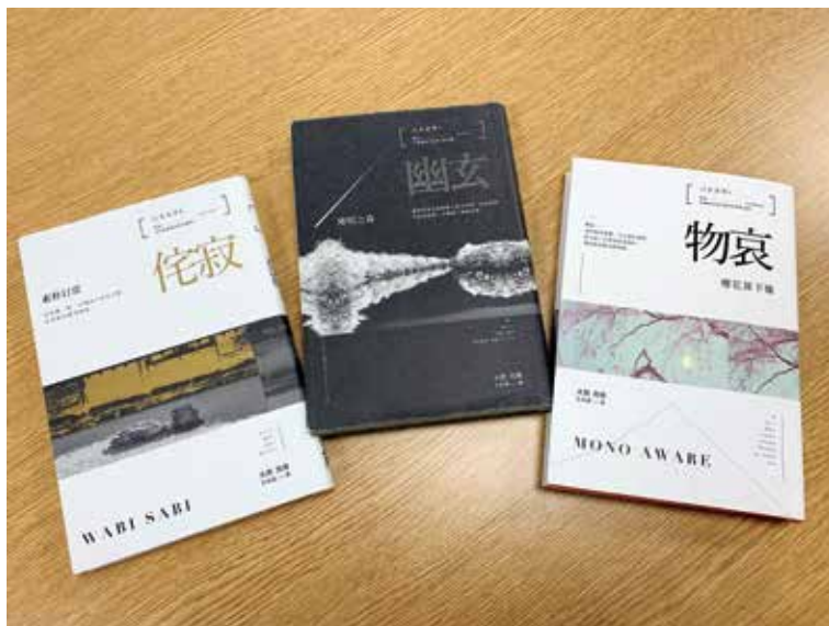
↑大西克禮的三本美學書

日本的美學家，也是東京帝國大學的名譽教授大西克禮寫了一系列三本關於日本美學的書：「物哀」、「幽玄」及「侘寂」，為日本特有的美學概念提出了論述，不僅成為日本美學的經典，也使我們更為瞭解日本的審美基礎。