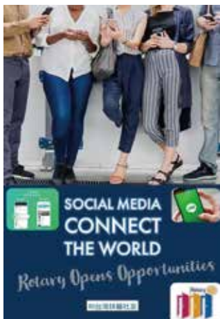
扶輪打開機會， 社群媒體連結世界