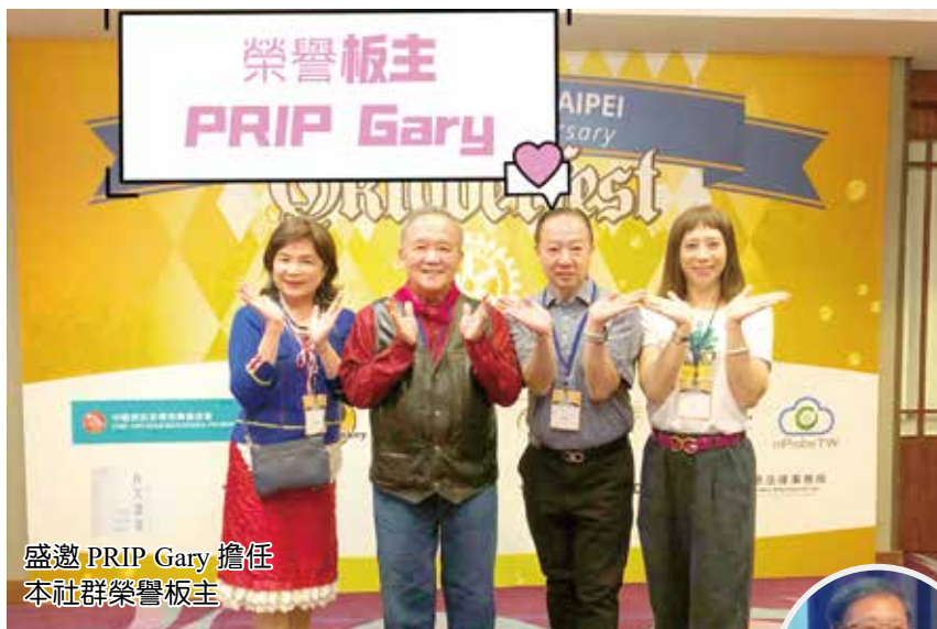
盛邀 PRIP Gary 擔任 本社群榮譽板主