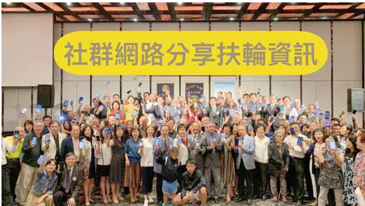
台南社社友、寶眷，開啟手機軟體歡迎您加入

是完整的分享。糾察員會守著板面，針對按讚、Icon 和聊天內容。在相關聊天社員都看到後，以及發言者也得到反饋之後，實施刪除。大家都有認同群組訊息精緻化，就會有更多相同理念的前輩加入我們社群，扶輪人最高品質。