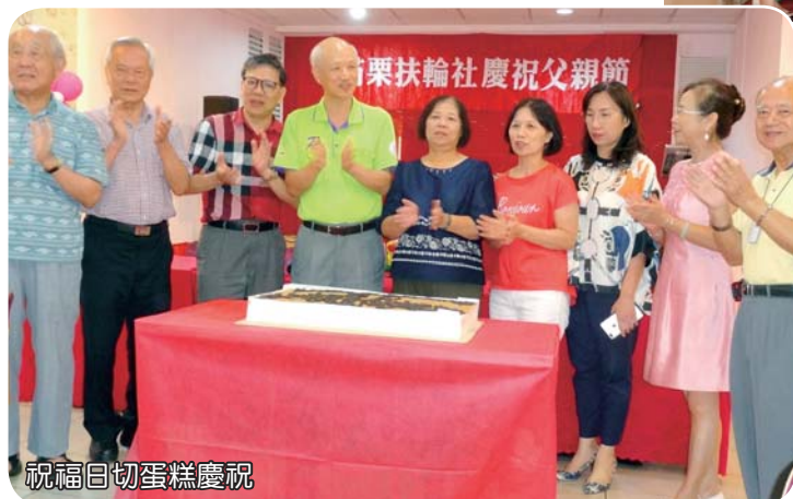
祝福日切蛋糕慶祝

到社會各階層的重視，所以要慶祝父親節。隨後社友家屬對父親節感恩的心發表象徵性影片，社長頒贈給每位社友的「苗栗社 50 屆週年慶紀念禮物」，是一套精緻的小茶壺，喜愛飲茶人頗為適用。