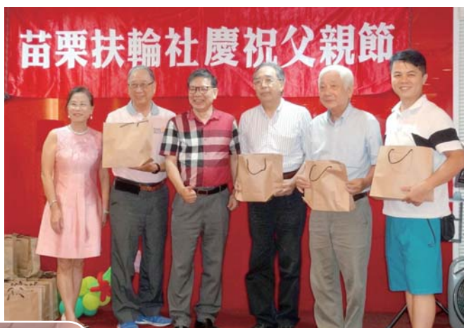
社長頒發 50 週年慶禮物