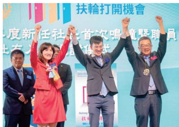
新社友入社授證儀式

分區) 港都社、巨港社、大都會社等各社社長率領社友們一同前來祝賀，席開 20 桌，氣氛熱鬧非凡。