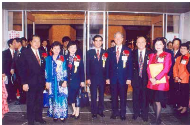
1999 年 3 月 21 日 3500 地區年會與 RI 社長代表及夫人和其他扶輪領導人

除了家人、親人，人還要有正常的社交活動，一些知己，志同道合的朋友，一起做些對社會、國家