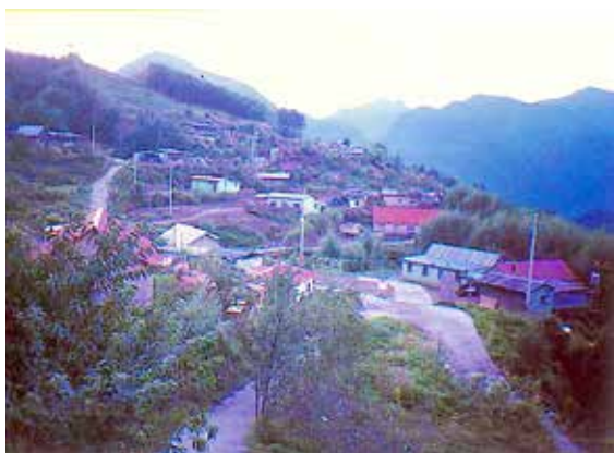
2000年9月24日中壢社 ——司馬庫斯捐贈計畫

有貢獻的事，那是生命中一大樂事，除了完善自己，也成就別人，盡一份社會責任與義務，看到別人因為自己一點點力量，改變了他們的人生，這才是社友最開心的事，而聚會，用餐只是一種表象，為執行公益活動所延伸與凝聚共識的活動而已。