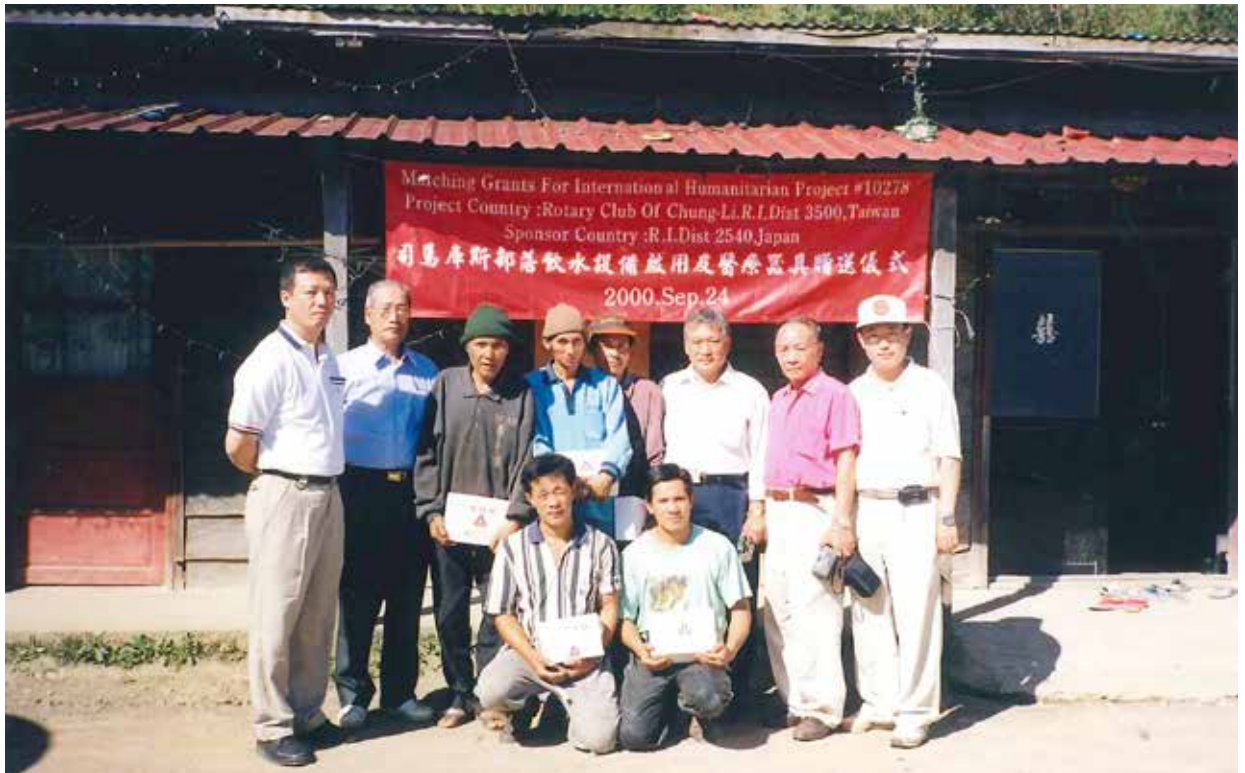
2000年9月24日中壢社——司馬庫斯捐贈計畫

有貢獻的事，那是生命中一大樂事，除了完善自己，也成就別人，盡一份社會責任與義務，看到別人因為自己一點點力量，改變了他們的人生，這才是社友最開心的事，而聚會，用餐只是一種表象，為執行公益活動所延伸與凝聚共識的活動而已。