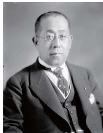
德川宗家——德川家達公爵 ——維基百科

侯爵：舊清華（註四）、德川御三家（註五）、15 萬石以上國守格大藩主、琉球藩主尚家。