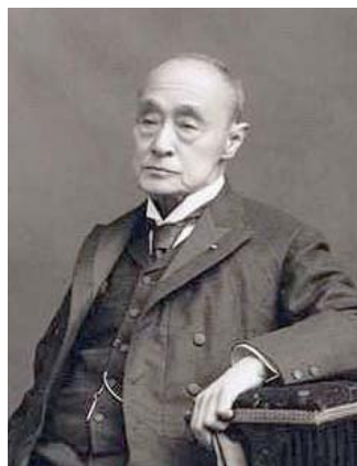
末代將軍德川慶喜公爵 ——維基百科