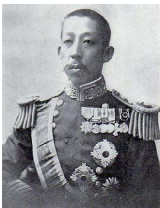
貴族院皇族議員伏見宮博恭王——維基百科