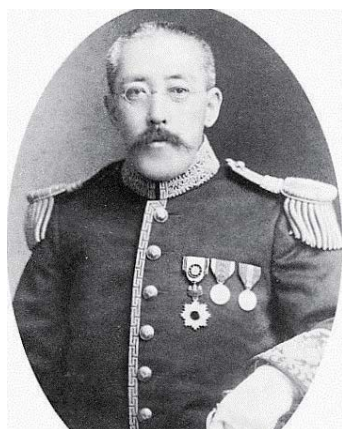
貴族院華族議員佐竹義生侯爵——秋田文物館