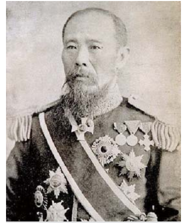
新華族的代表人物貴族院初代 議長伊藤博文——維基百科

命為敕選議員。1934年台灣的辜顯榮（彰化）、1945年許丙（台北）、林獻堂（台中）、簡朗山（桃園）等都先後擔任敕選貴族院議員。