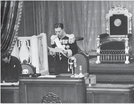
貴族院議長近衛文麿公爵——維基百科