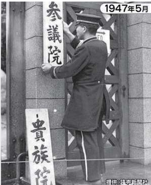
貴族院改制為民選參議院——讀賣新聞