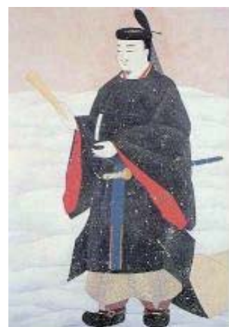
藤原朝臣道長公像 ——維基百科