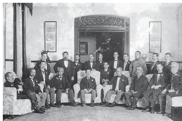
1913年5月8日貴族院議員德川公爵等一行訪問上海，接受孫文、黃興設宴款待