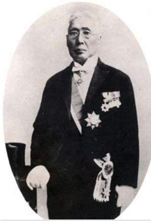
敕任貴族院議員辜顯榮—— 台灣文獻館