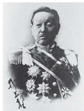
鹿鳴館創辦人外務卿井上馨侯爵

的外務卿井上馨伯爵即斥資建造了歐洲宮殿式的鹿鳴館，做為接待外賓或宴會的場所，極盡豪華奢侈之能事，當時被稱為鹿鳴館外交、鹿鳴館時代，後來改為華族會館，是王公貴族社交的場所。由於過於歐化奢華而遭受物議，遂於1941年被拆除。