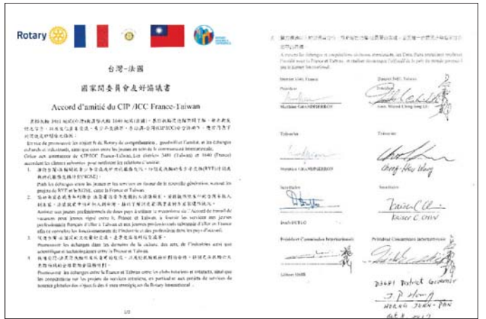
台灣／法國 ICC 協議書