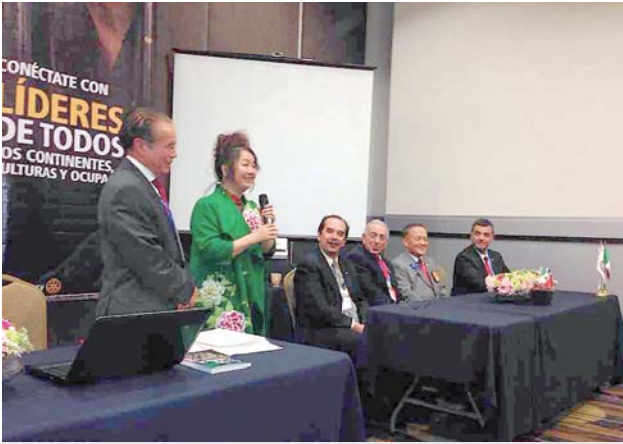
RIMEX 會議簡報介紹台灣