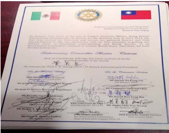
台灣／墨西哥 ICC 協議書

縱觀他國經驗，國家間委員會 ICC 能有效與其他國家發展新友誼，是極佳的工具和優良的平台，透過它，不僅扶輪社員彼此聯繫增加，也是扶輪地區領導人聯絡的進程關鍵。更進一步，在國際領域可以更深入地實施其他各