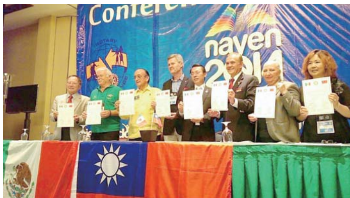
墨西哥 45 天，台灣／墨西哥 ICC 協議書終於完簽