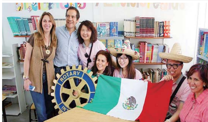
捐贈小學圖書館書籍