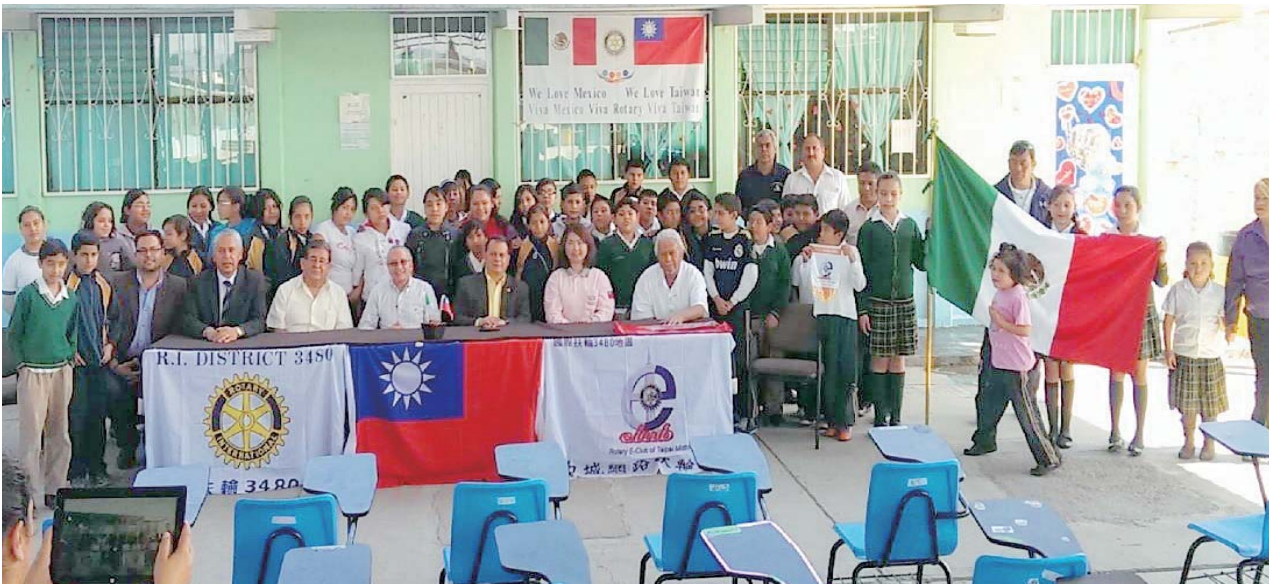
GG 1417611 D3480 中城網路社以 PHF 保羅·哈理斯與國際服務的合作夥伴 D4130 RC San Luis Potosi 合作興建電腦教室和廁所，同時拜訪小學與建地工程。

2013-14 年依 3480 地區國際主委 CP Aircon 之交代，率領台灣 3460、3480、3490、3520 四個地區（稱：ICC 創始地區）之代表，參加墨西哥第二屆 ICC 國際友好會議，在出訪前我們先請當時的 RI 社長當選人 Gary 在文件上簽署見證。到了墨西哥會議現場，因為只有當地總監出席，因此只好到各地區逐一拜訪、演講、遊說，終於在墨西哥停留的 45 天之內，順利地在三大扶輪會議中，取得墨西哥八個地區之總監的簽署，成功的完成了台灣／墨西哥 ICC 協議書。這是台灣 ICC 史上第一份簽署成