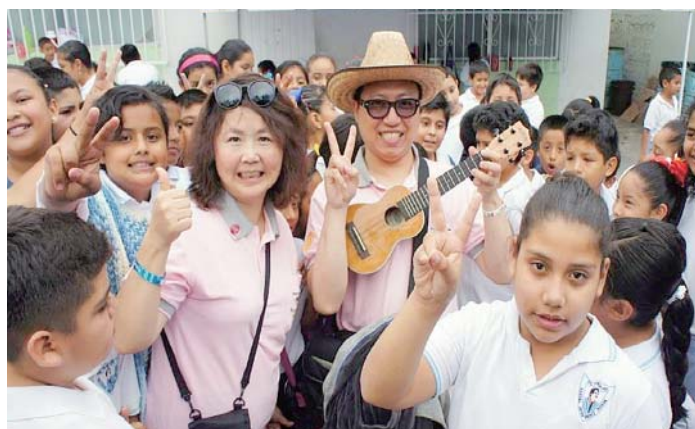
參訪 Veracruz 公立小學