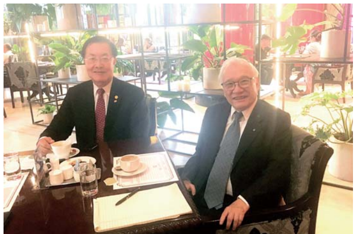
於圓山大飯店接受本刊採訪

一位擁有三十幾年資歷的扶輪社員，能夠在事業輝煌的春秋鼎盛之年，無怨無悔地投身扶輪運動，並持續 30 年的奉獻，確實難能可貴，也是我們扶輪社員的典範，也期盼台灣的扶輪社員能夠一本初衷，繼續支持國際扶輪基金會。