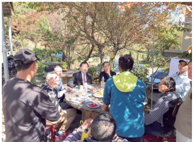
新竹鎮西堡給水服務計畫——碰到問題於樹下開會照