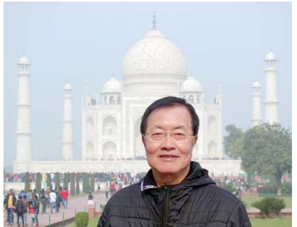
以 RIPR 訪問印度順便遊泰姬瑪哈陵

本年度開始他將接任非常重要的國際扶輪基金會保管委員，在四年的任期內，也兼任扶輪基金會財務委員會委員、國際扶輪審計委員會委員（三年），以及 EPN 倒數計時挑戰委員會共同主委（三年）等