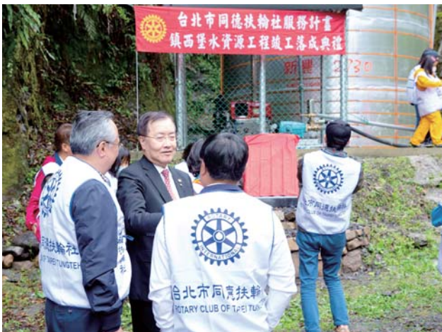
新竹鎮西堡給水服務計畫竣工

1998 年是他人生的第二次轉折，也是開啟他第二波扶輪生涯的契機。是年他接受了地