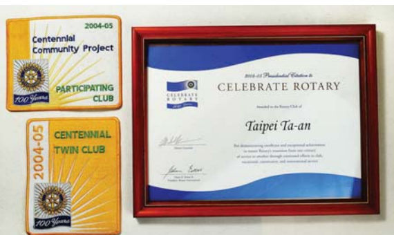
獲得 2004-05 年度 RI 社長獎

2016-17 年度，有幸擔任 3480 地區第 7 分區的助理總監，分區內共為 8 個社，那時 3480 地區全部約有 130 多社，社友人數五千多人，分成 16 個分區，也是 D3480 的末代助理總監，隔年則分為 3481 與 3482 兩個地區，