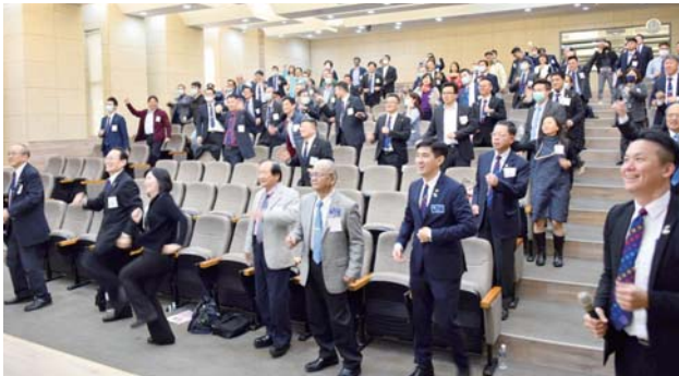
2月22日 CTTS 社訓練師訓練研習會

我第一次去參加時，眼前看到一群面帶笑容、容貌姣好、身著華服、說話輕聲細語的優質女性，我因為當天早上看完門診就匆忙去參加也沒有打扮，當下覺得難道這是另一個平行世界嗎？也記得當天有位前輩大叔社友在教唱扶輪頌，我只覺得那有到這個年紀還要這樣唱歌的社團，真是奇特又有趣。Lens 前輩會後