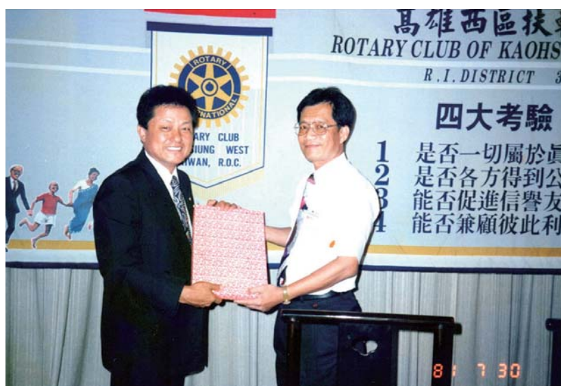
高雄西區社社友職業介紹

1993 年的 2 月，引領我進扶輪的 CP Dent 邀請我一同創立新社。6 月 8 日，我成為高雄圓山社的創社社友。由於有正確的觀念及志同道合的社友，我們為圓山社立下了「凝聚成圓·茁壯如