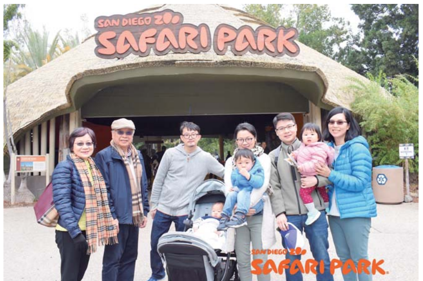
DG Pipe 全家於聖地牙哥動物園合照