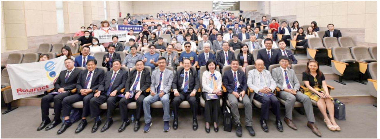
5月17日扶青社地區領導人訓練研習會

又一直打電話提醒我星期三中午記得去參加例會，他可以來載我去！天啊！是綁架吧！我又因為不好意思拒絕就再次前往例會，最後就成為台美社創社社友，而這樣一試成主願愛上扶輪。45歲參與扶輪真的是人生第一次的青春，例會的演講、會後的聯誼、社外的服務、授證的歌舞表演，打開了我人生的另一扇窗，改變了我的人生。