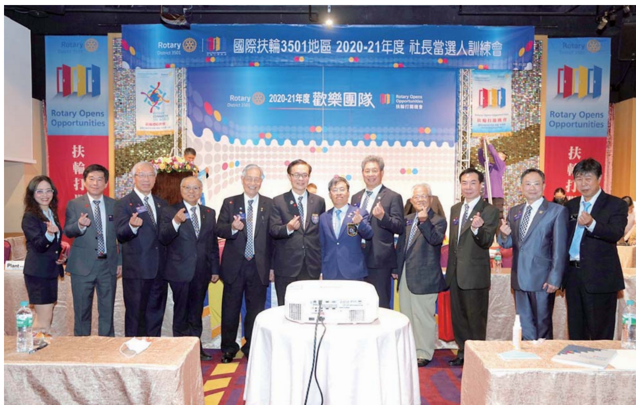
國際扶輪 3501 地區社長當選人訓練會