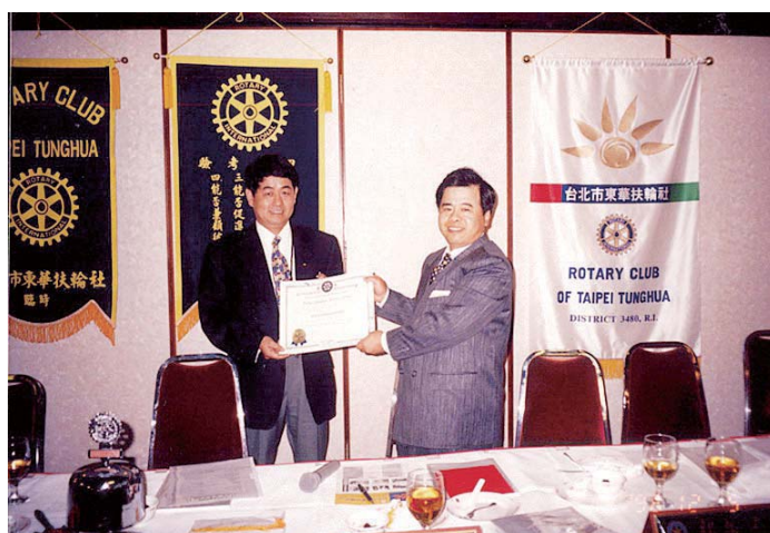
1996 年 12 月 5 日保母 PP Idea 代表頒發 RI 創社證書

由於我服役期間在衛武營的醫療所牙科，加上晚上又在外面的牙科上班，所以退伍後即在台北市忠孝東路開設華仁牙