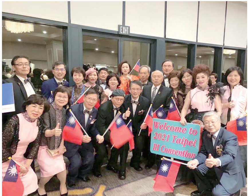
2020 年 1 月 22 日，參加 IA 會議大遊行前台灣團隊合影