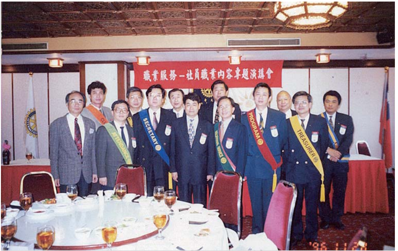
1996年11月28日第一屆職委員合影

輪的人生。記得三十多年前要入扶輪社不是一件很容易的事，我從申請到入社幾乎等了一年之久。因早期每個職業只能有一位社友，如果請假四次就被退社，在我入社前的一位牙醫師，斷斷續續在東北社，他沒有退社我就無法入社，所以入社等了很久。