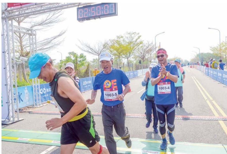
2020年2月28日國際扶輪3461、3462地區228扶輪盃馬拉松接力賽暨扶輪有愛反毒啦啦隊宣導活動

加入扶輪社，讓我的人生更多采多姿，我接任各種職務，擴展了國際視野，結交社會賢達，投入各種公益活動，同年齡的朋友都退休養老了，我卻每天忙碌於參加各項活動而樂此不疲，希望有生之年對社會做出一點貢獻，也不枉費虛度一生。