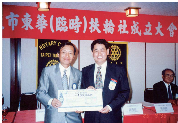
1996 年 9 月 26 日東北輔導社 Sols 社長致贈創社基金

科診所，迄今已有 42 年。1988 年，因開業已有十多年，累積了一點積蓄，考慮到未來職場的競爭，醫療技術必須提升，所以就邊上班邊到日本就讀日本岩手齒科大學，直到 2000 年時取得日本岩手醫科大學的齒學博士學位。也在 1998 年在美國紐約大學，利用一次上課在台灣，一次在美國的方式，完成了兩年的植牙課程的訓練。二十年前算是早期台灣的植牙醫師。在醫療領域裡我始終認為只有不斷透過進修，醫術才能趕上時代。目前診所的工作已慢慢由同樣是牙科醫師的兩位兒子兩位女兒承接。