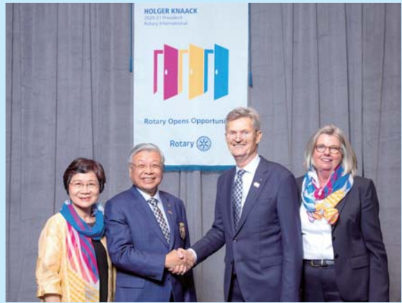
DG Pipe 伉儷與 RI 社長 Holger Knaack 伉儷合照

我出生於台南市東山區三榮里（原台南縣東山鄉下寮仔），祖家務農，由於先父的努力、白手起家，我自小就在先父身邊幫忙，及至初中畢業，到外地求學，高中、大學、就業等，20 年來在外的生活、學習，及至民國 75 年再回東山，為南亞塑膠公司的經銷商，在先父的教導與扶持下，從小經銷商，經營到目前的一個小規模。