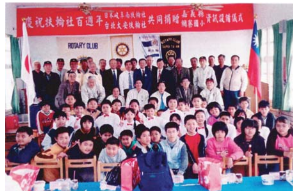
2004-05 年度完成 "Twin Club" 國際服務計畫

RI 社長為促進世界聯誼和平，設立了一項叫 "Twin Club" 的國際服務計畫，也就是在當年度，能夠與國外姊妹社，共同完成一項國際性的社區服務活動，即可獲得 RI 社長獎。