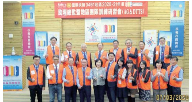
助理總監暨地區領導人訓練研習會