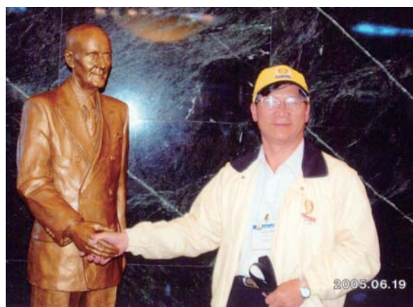
與保羅·哈理斯銅像握手合影

當年全地區僅有 20 餘社獲得 RI 社長獎，而我率領的第 7 分區，就有 5 社獲得 RI 社長獎，且 7 個社都獲得地區總監金牌獎項。被肯定讚賞是個具有優質領導力的 AG。