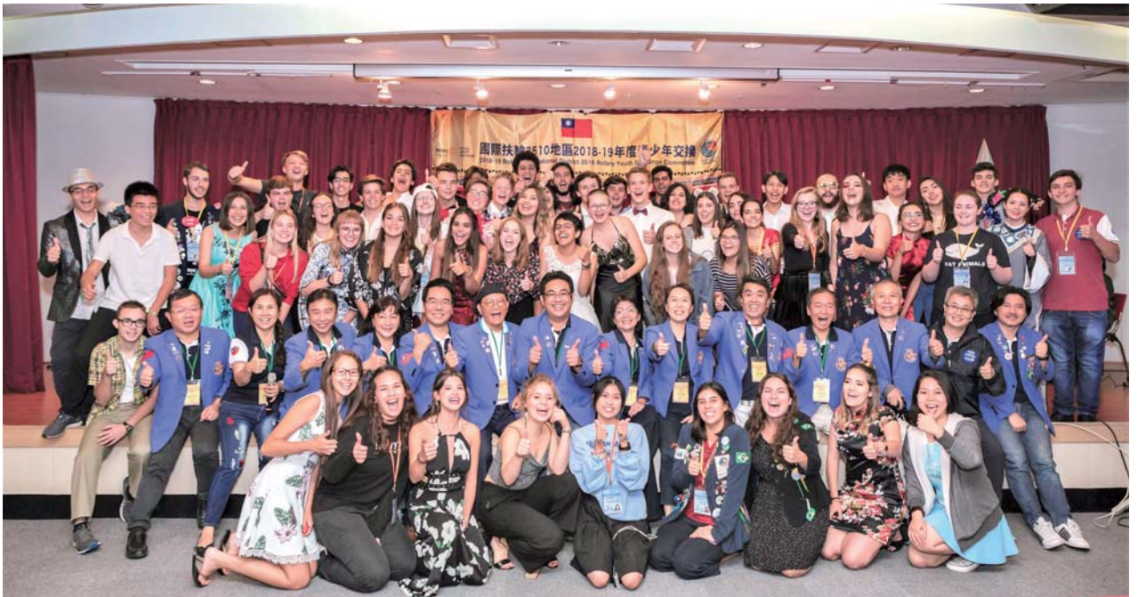
2018年12月15日 RYE 華語歌唱比賽

2003年受PDG Plastic的抬愛擔任了地區副秘書長（現在稱副助理總監的職務），開始了我地區的服務工作。10幾年來，已分別歷練了多種任務，有地區的社務行政、國際服務、青少年服務等。而更多的機會是在地區年會的領域上磨練，從各委員會主委，2任籌備