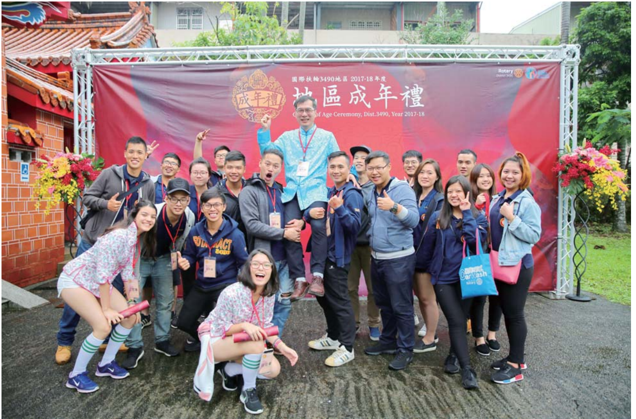
地區成年禮與 RYE 及扶青社合影

日之星都被我們延攬培養成為 2020-21 扶輪年的「總監團隊」，而且我們了解必須找尋正直