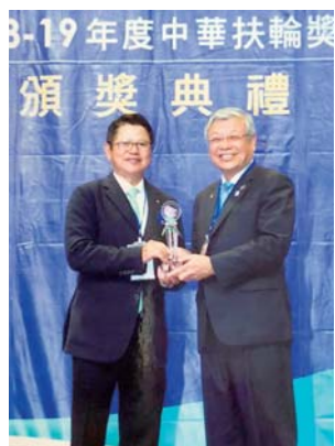
DG Pipe 2018-19 年度與 中華扶輪教育基金會 董事長合照