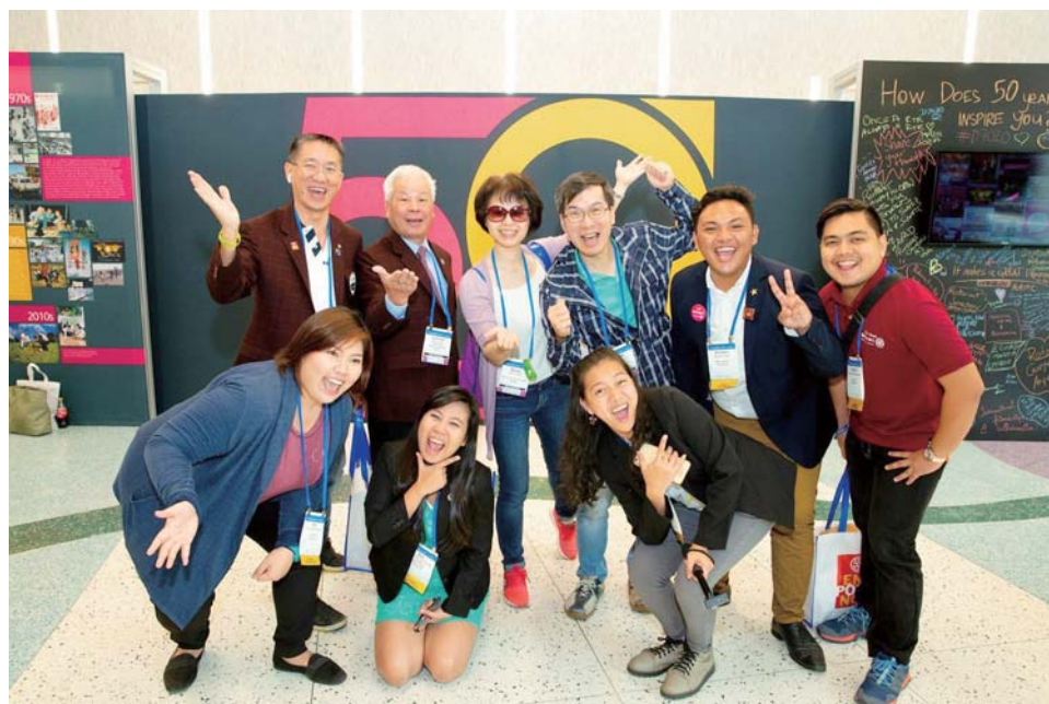
RI 扶青 50 週年多倫多國際年會

員會。采鈴和我是一人當選兩人服務，采鈴雖是寶眷社友，不過她也涉入頗深，她是我的好夥伴，我們常常一起討論扶輪與服務，所以聯誼的時候，她有沒有出席往往是人們的焦點，頗令人驚奇。這樣多的服務之中，我們倆最喜歡扶輪的建構項目即國際服務和青少年服務，因此結識了這個領域中的很多好朋友，學習了很多領導能力與知識，這群明