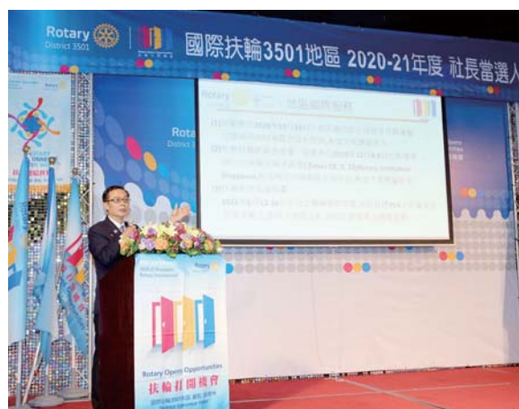
國際扶輪 3501 地區社長當選人訓練會