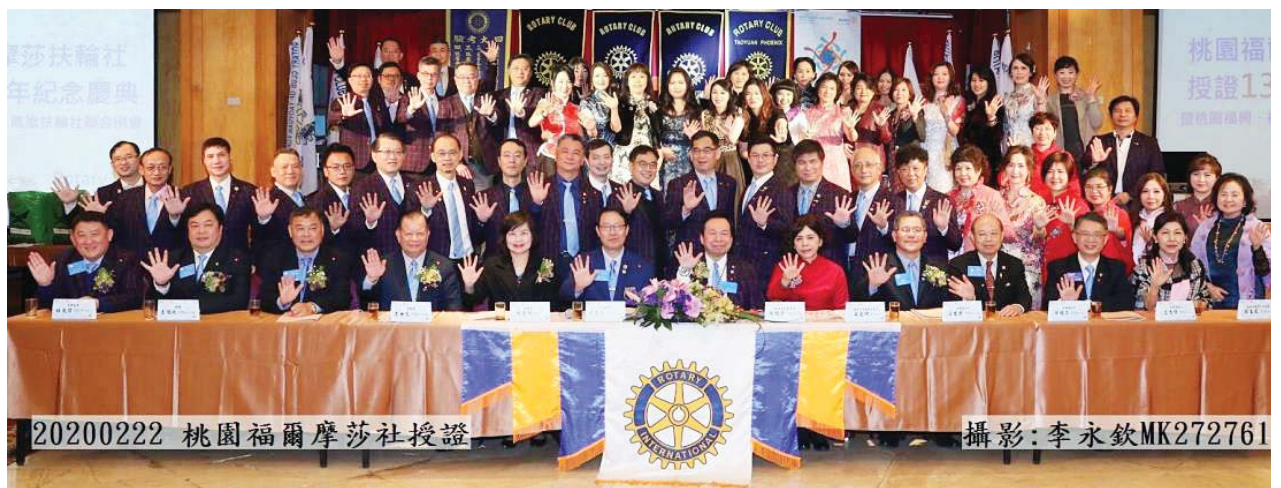
桃園福爾摩莎社 2020 年 2 月授證合照