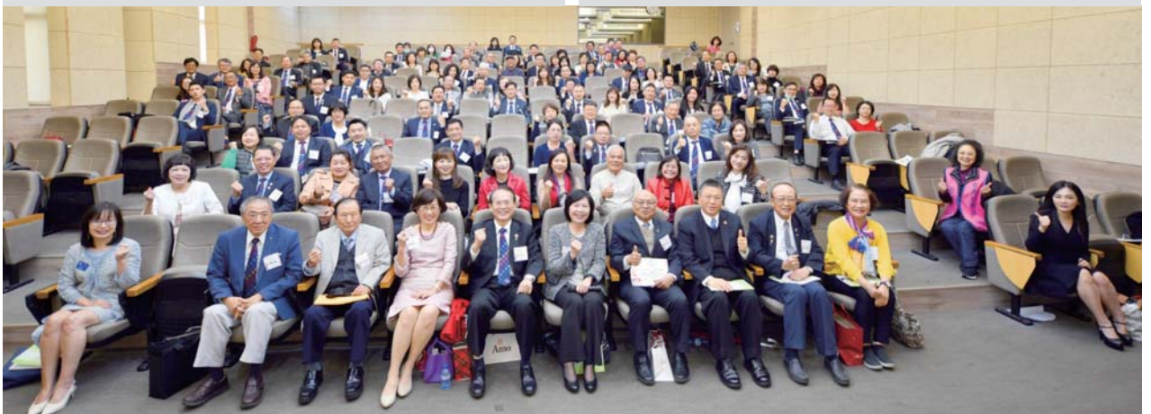
3月14-15日社長訓練研習會