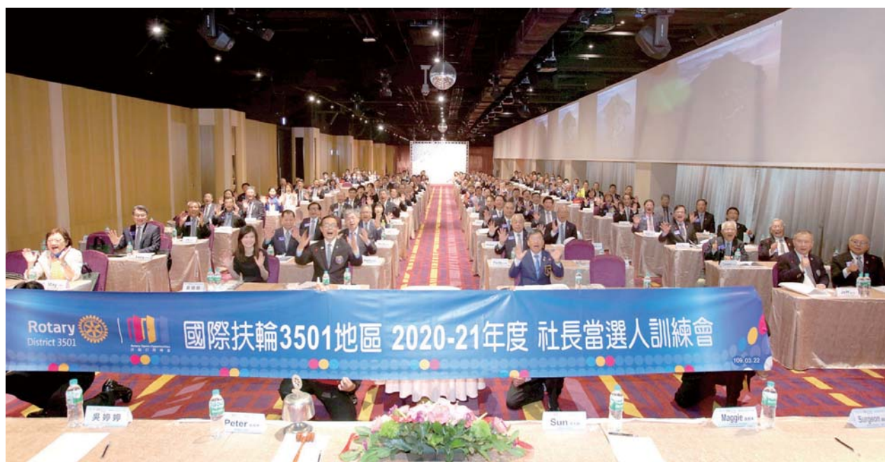
國際扶輪 3501 地區社長當選人訓練會

2017-18 苗栗第 2 分區助理總監 地區講習會主講人 3501 地區總監提名預定人