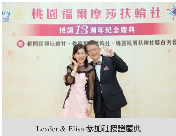
Leader & Elisa 參加社授證慶典

2021 年台灣即將舉辦國際年會，我們從 2020 年開始，所有的訓練、演講或與社友接觸、聯誼的機會，都在推動國際扶輪年會，期望台灣的社友們，能支持國際年會，達成 HOC 給我們的目標。我們深深期望，明年的國際年會，不會受到疫情影響，讓 2020 年取消的夏威夷年會的失望，重新在台北年會，發光發熱，全世界社友們，能夠共同歡樂在台灣，創造歷史奇蹟，這樣我們就會覺得這一年很有意義。