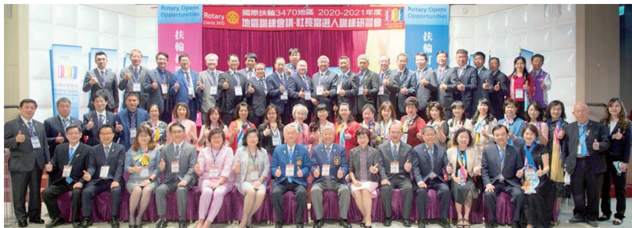
社長訓練會大合照

希望各社社長帶領所有社友，盡力來完成我們的扶輪目標，尤其是「2021國際年會在台北」的註冊及各項活動。最後願大家參加扶輪；學習扶輪；服務扶輪；並享受扶輪！