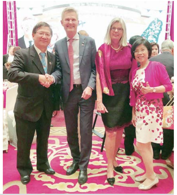
與 2020-21 年度 RI 社長德國籍 Holger Knaack 賢伉儷合照

勵，推薦我為 2020-21 年度總監提名人之候選人，經由資深 PP 陪同到各社自我介紹及建立聯誼，最後以壓倒性的多數贊成票，當選為 2020-21 年度也就是國際年會在台北舉辦的地區總監提名人 (DGND)。