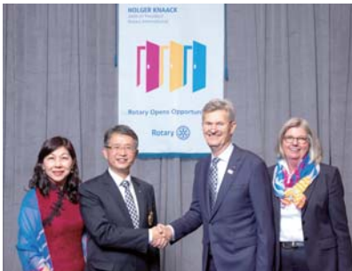
IA 訓練，與 RI 社長 Holger Knaack 合照