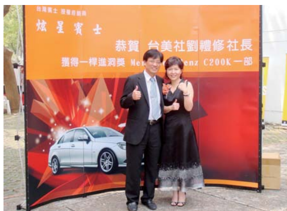
2009 年 3 月 12 日擔任台美社第 6 屆社長於地區年會主辦的高爾夫球賽中一桿進洞得到賓士車一輛

更怕讓父母失望，從板橋國小、光仁中學一直到台北醫學院，我的人生中沒有青春期的。我也因為從高中起到進入職場服務都是和男同學、男同事一起競爭造成了我的思考邏輯偏向男性化，行為模式也偏男性化。我在加入扶輪社之前很少穿裙子也從不穿露手臂更不用說是露肩露胸的衣服。還好我很正常的在 1985 年結婚，先生是耳鼻喉科醫師，我們生下兩個美如天仙的女兒，現在有兩個很帥氣的女婿。而生活就是在家庭和職場中打轉，身邊的朋友也都是醫界人士。