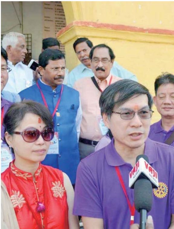
印度扶輪友誼交換

永生難忘的我們這一年，幸運地適逢時隔 27 年再度主辦台北國際扶輪年會，從第 85 屆 RI Convention 在 1994 年 6 月 12-15 日乾杯在台北“GAN-BEI IN TAIPEI”進化至第 112 屆在 2021 年 6 月 12-16 日感受台北的活力“FEEL THE ENERGY IN TAIPEI”是台灣在辦喜事，展現我們台灣，節目非常精彩，期待大家的參與。最後一句話期待大家參與，這個很重要，謝謝大家的支持與鼓勵，我們會努力。