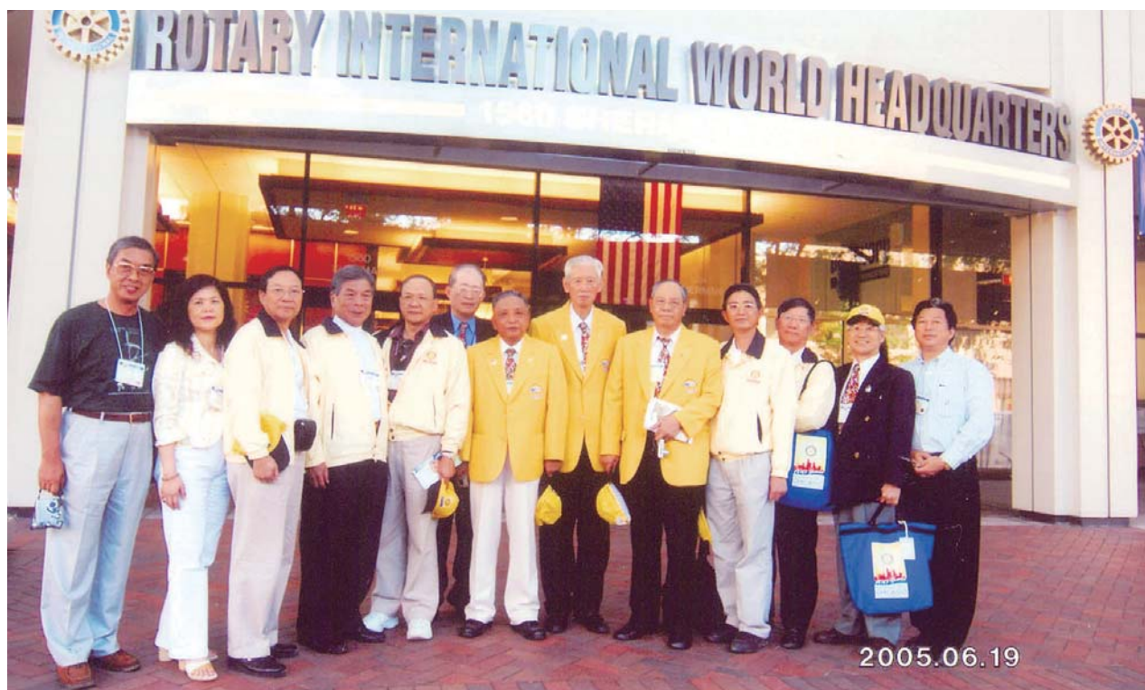
扶輪百週年擔任社長第一次參加國際扶輪年會，在芝加哥拜訪RI總部