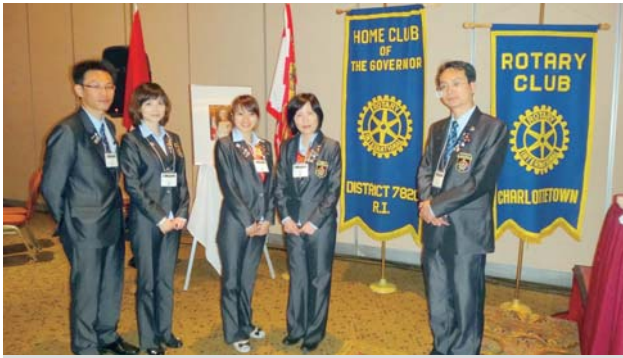
2012年5月8日擔任 GSE 團長帶領 4 位團員前往 D7820 參訪，並且在年會報告 D3461 扶輪發展