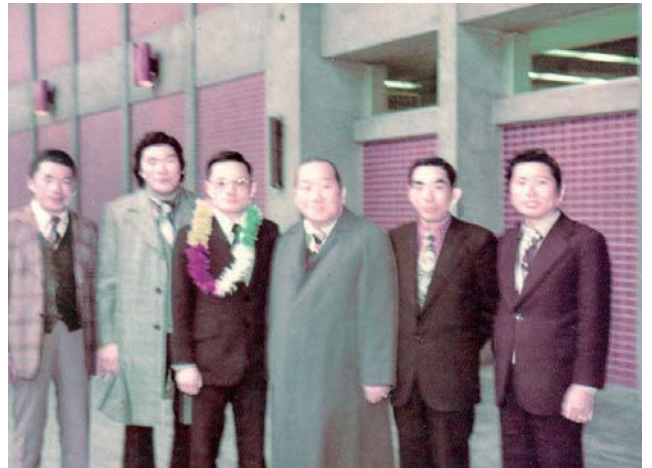
父親在機場送長生出國留學

了一個「好名字」！我也這樣認為；我取「Good News」的來由是有 2 個原因，一、我在 1975-77 年去美國留學時，有機會認識了上帝，相信耶穌基督是救贖主，而聖經中的傳達上帝救贖的福音，在中文又將福音稱之為「好消息」，我回國即進入家族事業——台灣廣播公司工作，當我成為扶輪社友，被要求要一個稱呼 (nickname) 時，我就想廣播是新聞媒體與 News 有關，我又是基督徒，乃選用了「Good News」作為我在北區社的 Nickname。