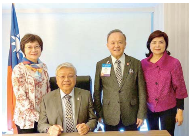
DG Pipe 伉儷與 PRIP Gary 伉儷合照