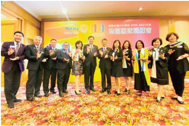
Leader 與 AG 們合影