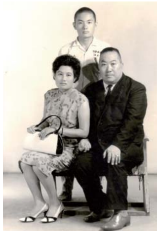
高中畢業與父母親合影

我的 nickname 為「Good News」，很多人第一次見面彼此請安稱呼時，都會覺得我取