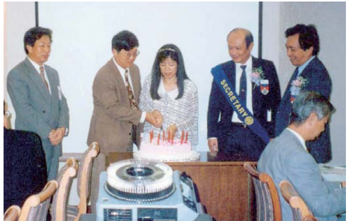
接受台北大安社慶祝入社儀式