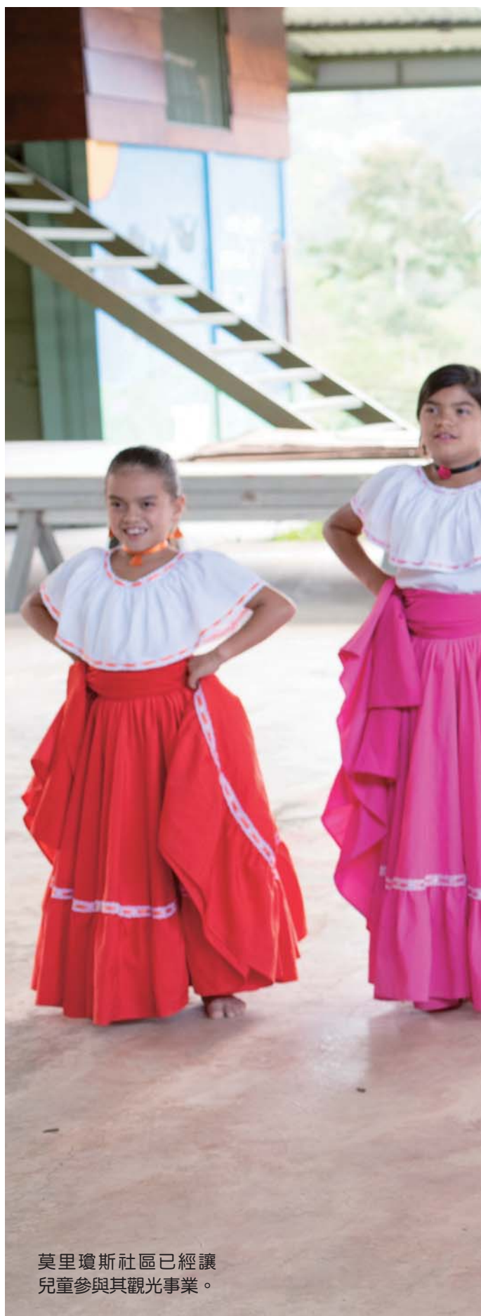
莫里瓊斯社區已經讓 兒童參與其觀光事業。