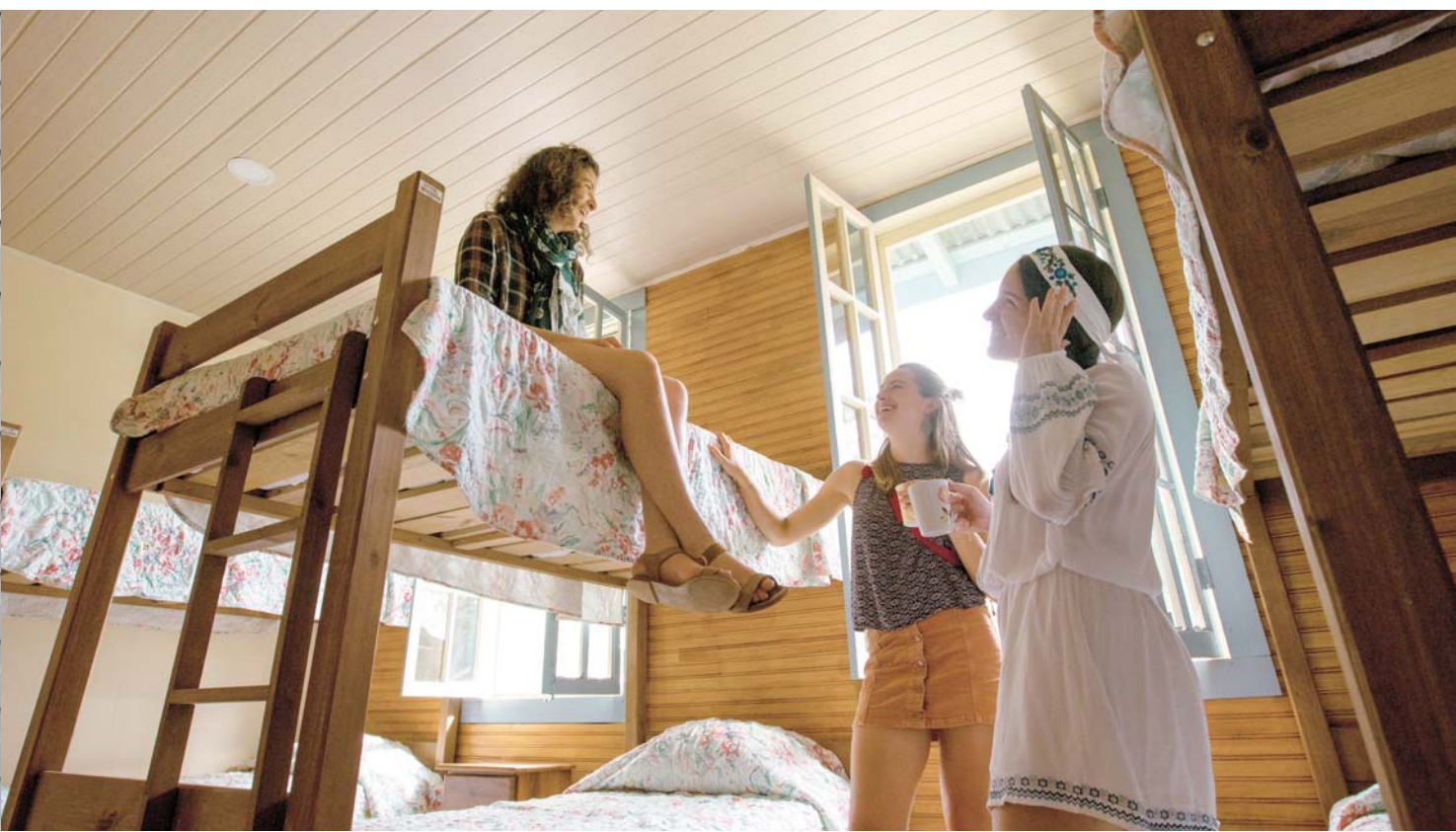
這間房子可以作為造訪此區域之旅行團的生態旅館。

方，高聳的山脈成為令人屏息的背景。這份以自家後院農產品為特色的午餐同樣令人歎為觀止。這可能是一個輝煌職業生涯的開始。