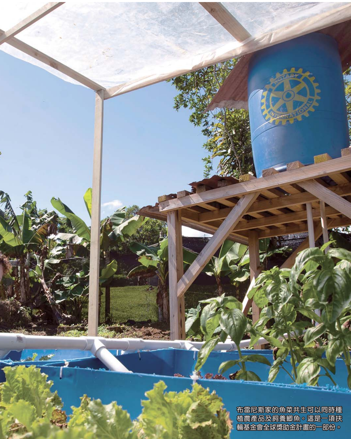
布雷尼斯家的魚菜共生可以同時種植農產品及飼養鯽魚。這是一項扶輪基金會全球獎助金計畫的一部份。