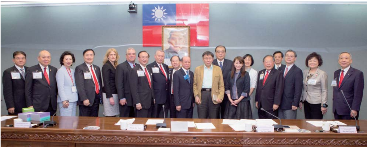
2021 台北國際扶輪年會地主籌備委員會 (HOC) 團隊拜訪台北市市長柯文哲並簽定合作備忘錄