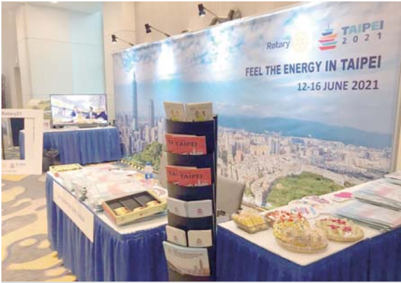
2020 聖地牙哥國際講習會 (IA) 積極宣傳台北國際扶輪年會

報名人數叩關的台北國際扶輪年會主委——謝三連，他的家庭、事業、投入扶輪和公益參與，以及給新世代扶輪人的提醒和對台灣扶輪如何走的觀點，值得我們好好的看下去……。