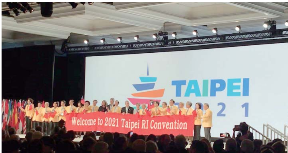
美國聖地牙哥的國際講習會 (IA) 會中宣傳 2021 台北國際扶輪年會，剛好是中國人的除夕夜，「恭喜恭喜」聲不絕於耳，一炮而紅！