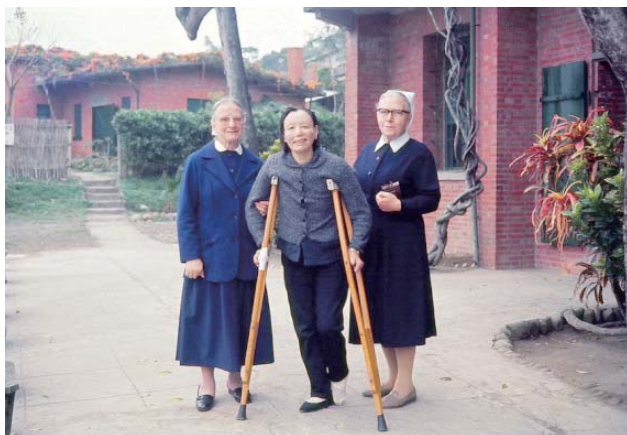
戰後的樂山療養院生活照 1 ——樂山教養院