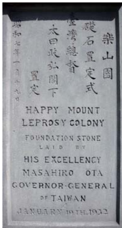
樂山園礎石 ——樂山教養院