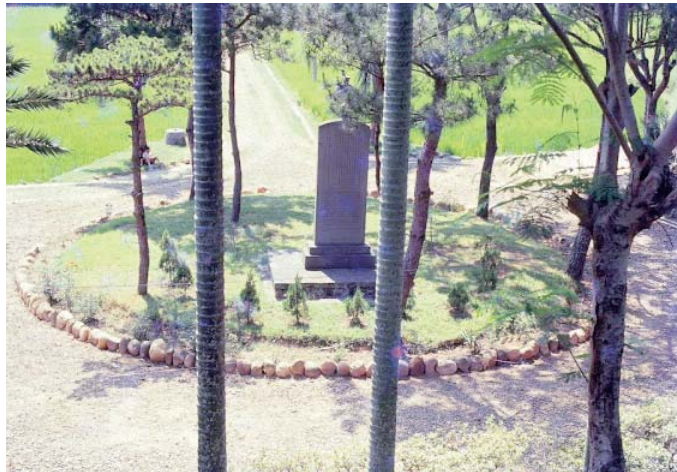
戴仁壽夫婦墓園——樂山教養院