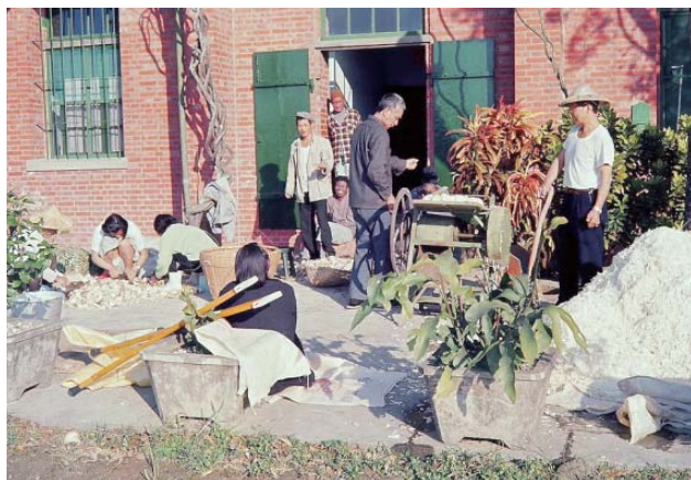
戰後的樂山療養院生活照 2 ——樂山教養院