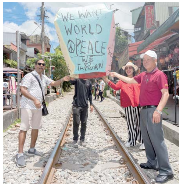
PDG Concrete 陪同達克珠伉儷遊北海岸／平溪 施放祈求和平天燈