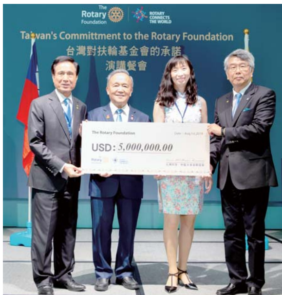
捐獻 500 萬美元給扶輪基金會

達克珠伉儷於 7 月 31 日下午抵台，由 E/MGA Ortho 與 PDG Concrete 接機，晚間由 PRIP Gary 作東招待晚餐。8 月 1 日早上，由 PDG Concrete 陪同遊覽北海岸，寫毛筆放天燈；8 月 2 日由 RIDE Surgeon 伉儷與 IPDG Alan 伉儷陪同遊覽桃竹苗地區；8 月 3-4 日由 E/MGA Ortho 偕同花蓮分區光耀團隊，遊覽花蓮風景並參訪全球獎助金計畫成果；8 月 6 日由 RRFC William 於高雄接待，會見當地社友。8 月 7 日達克珠伉儷結束八日訪台行程返回印度。