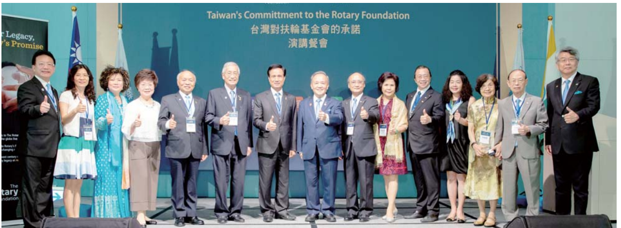
新增 AKS 會員與基金會領導人合影