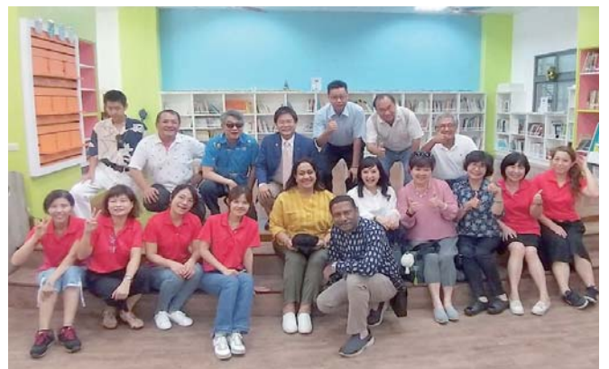
參觀全球獎助金計畫——花蓮北倉國小圖書館