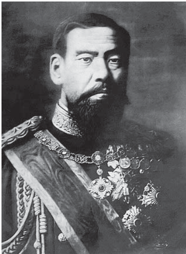
明治天皇——維基百科