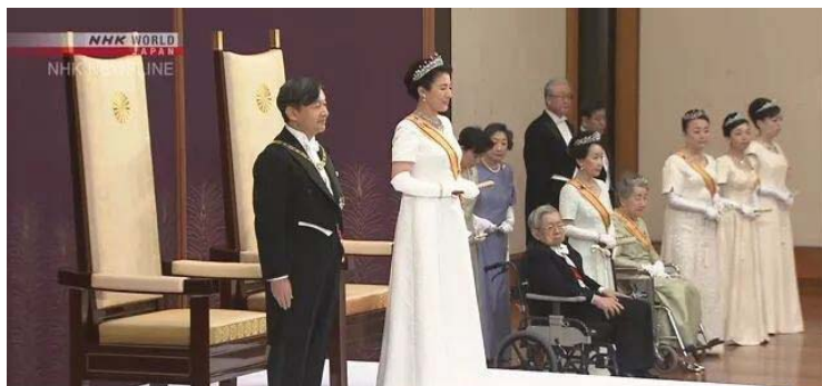
德仁親王登基