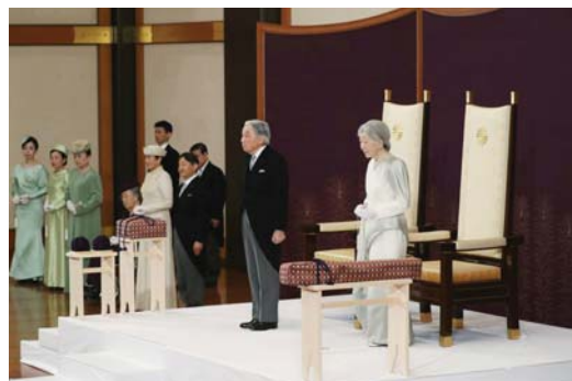
明仁天皇退位——宮內廳網站

最近與日本相關的重要話題，大都圍繞在明治維新 150 週年紀念，以及明仁天皇退位，德仁親王即位改元「令和」的兩件大事。明治維新代表日本從擺脫封建時代到成為文明強國的標竿；而明仁天皇生前退位的高度評價，也提升了日本皇室的尊貴象徵。