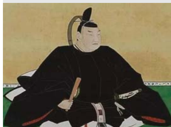
死因不明的孝明天皇 ——宮內廳檔案