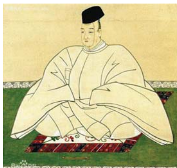
光格天皇

明仁天皇的退位，距 1817 年第 119 代光格天皇的退位，剛好跨越兩個世紀。當年光格天皇兼仁是在江戶時代末期的 19 世紀初，以體弱為由宣告退位，由皇子惠仁親王繼位，是為明孝天皇，此後歷經孝明（統仁）、明治（睦仁）、大正（嘉仁）、昭和（裕仁）、平