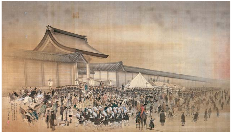
戊辰戰爭繪圖——小波魚青繪——日本京都文化博物館