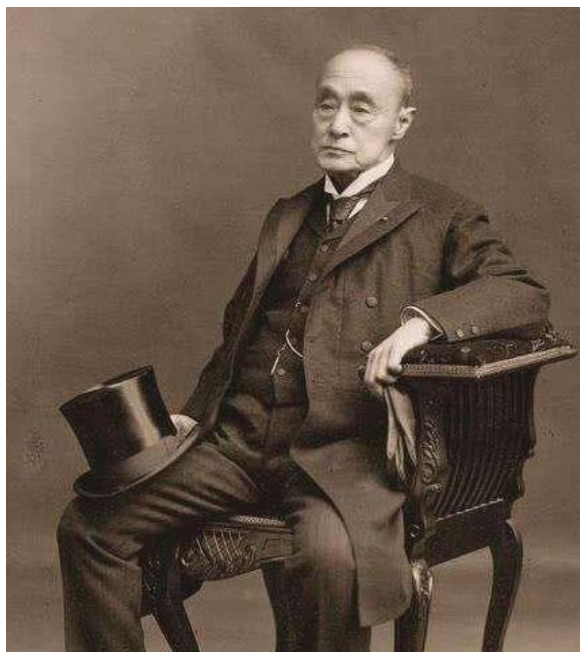
末代幕府將軍德川慶喜受封為公爵 ——高松宮妃癌研究基金會

1867 年（慶應二年），孝明天皇突然駕崩，睦仁親王繼承皇統，繼續沿用慶應年號，1868 年（慶應三年元月三日），明治天皇頒布「王政復古大號令」，宣布廢除幕府，並令德川慶喜「辭官納地」。慶喜不從，薩長聯軍乃發動「戊辰戰爭」，由薩摩藩西鄉隆盛任總指揮，兵臨江戶城下，幕府乃不得不派勝海舟與西鄉隆盛議和，得以不流血入城，長達七百年的幕府體制終告瓦解。惟東北地區諸藩，仍然組成奧羽越列藩同盟，繼續反抗政府軍，後來勢力強大的出羽秋田藩藩主佐竹氏退出同盟，轉而支持版籍奉還，使得奧羽越列藩同盟