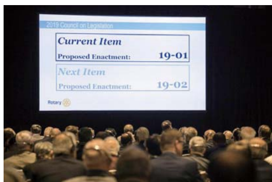
2019 年芝加哥立法會議代表對本週的第一項建議案：對服務途徑序言的修正案進行表決。

立法會議還將一般總盈餘基金 (General Surplus Fund) 的名稱改為國際扶輪準備金 (RI Reserve)，因為如此更能準確地反映此一基金的目的。在另一次投票中，立法會議通過將秘書長的名稱在扶輪圈外改為稱為執行長 (CEO)，以提高他與其他跨政府組織交涉時的地位。