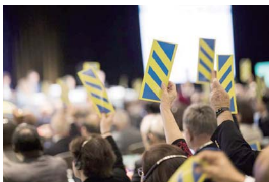
代表們投票決定結束一項對立法會議建議案的辯論。