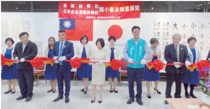
台日學生書法展剪綵揭幕

日本多治見西社會長藤明表示，苗栗社與日本多治見西社 1974 年結盟至今 45 週年，1977 年起透過書法和繪畫展示會於兩地先後展出，不僅要珍惜現在兩個社團建立的關係，邁向未來，希望更加深彼此關係，台灣小學生的書法跟繪畫在多治見西展示時，日本的父母親對於日本大人沒有辦法寫出的字表示非常讚賞，不愧是充滿漢字人才的國家。