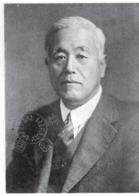
大谷光瑞伯爵 ——京都と君府

清朝時代並無近代化的獨立司法制度，因此司法案件都由縣官的心證來判決，而牢獄的管理也只是懲處，而沒有教化的機制。直到 1895 年日人領台之後，才將清制的牢獄改為刑務所，並於 1900 年開始由隨軍來台的淨土真宗本願寺僧侶施予教誨課業。後來發現監獄內關押了一些未滿 18 歲的罪犯，淨土真宗認為少年犯不應該以一般罪犯的方式懲處，因此向總督府建議制訂少年感化制度，並設置機構，以收容 18 歲以下的犯法少年。