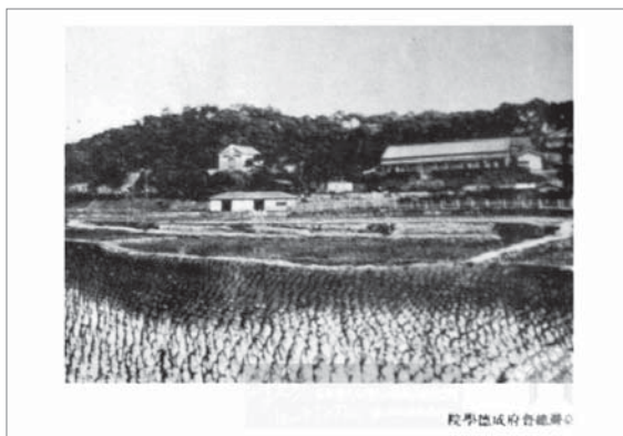
承德學院——台灣典藏

1922 年 4 月總督府公布感化院官制命令，於是經營十多年的成德學院在總督府的要求下讓出經營權，改制為總督府直屬管轄機構的「臺灣總督府立成德學院」。同年新竹監獄也