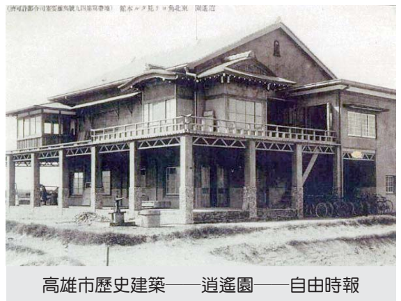
高雄市歷史建築——逍遙園——自由時報

隱退後的大谷光瑞伯爵於 1917 年前來臺灣視察時，發現台灣美好的自然環境，很適合他的退休生活，於是就在高雄建了一棟花園別墅——逍遙園。並於 1940 年曾來台短暫居住於逍遙園別墅。此後又回到大連定居，直到 1947 年才返回日本終老。由於他一生涉入政治較深，因此身後評價不一，各有褒貶。