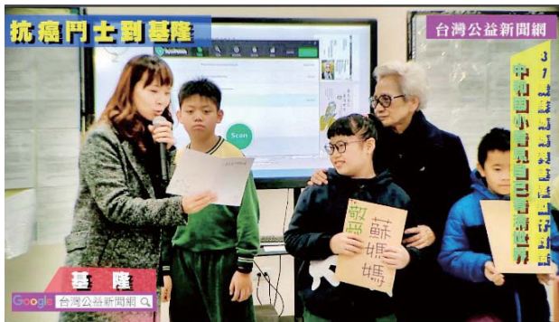
「蘇媽媽愛悅讀——與作家有約」，分享生命故事（圖為基隆中和國小）。