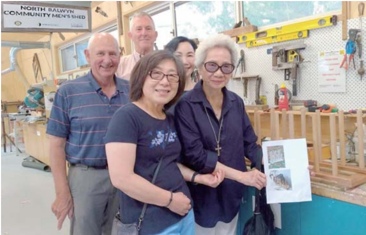
參訪澳洲墨爾本 North Balwyn 扶輪社建立的社區男人棚學習機構

授命擔當社長重任，小兒子一直提醒：「媽您要三思啊！扶輪社都是高人，您年紀這麼大了還要接這麼大的重任嗎！」蘇媽媽向高人學習的硬頸個性，如期接了2017-18年度社長，這一年是國際扶輪3521創區元年，她沒有因為年長只享有社長虛名，親力參與三出（出席、出錢、出力）許多活動與服務計畫，在社內、地區和跨地區的活動中都可以看到她的身影。