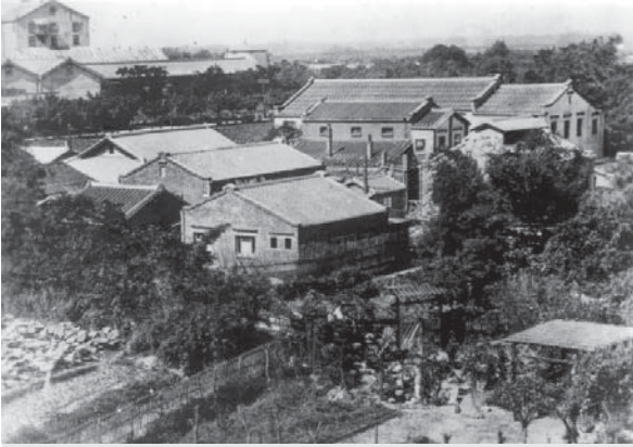
愛愛寮鳥瞰圖——愛愛院