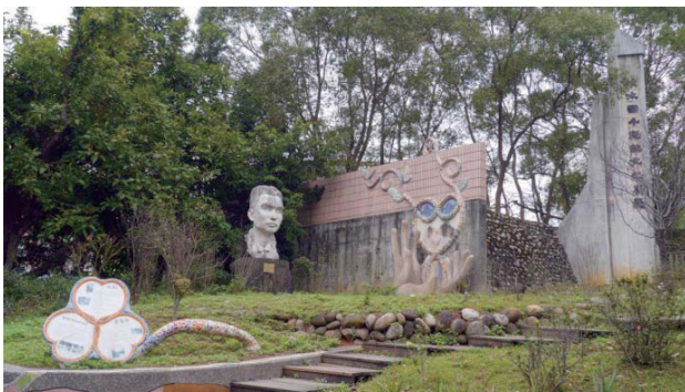
淡水國小內之施乾雕像——愛愛院

合計 244 人。但是清水照子仍然不顧辛勞，每日與丐民共同生活起居，為丐民清潔、敷藥、餵食，並教導良好的生活習慣，而被譽為「乞丐之母」。