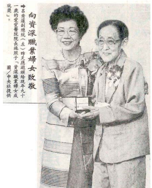
向資深職業婦女致敬——聯合報

目前愛愛院的病床也不停的擴增床位中，同時更開辦了巷弄長期照護站之社區關懷據點，將秉承施乾及施照子慈愛的精神，繼續為社會福祉努力。