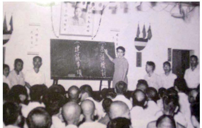
愛愛院院民會議——愛愛院