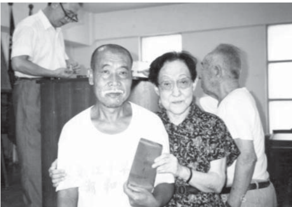
施照子與院民——愛愛院