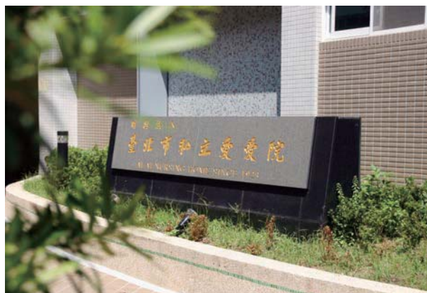
私立愛愛院現址——愛愛院