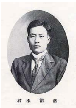
蔣渭水——walking book 行冊