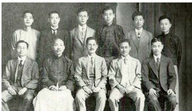
1927年矢內原忠雄訪台與民主運動人士見面