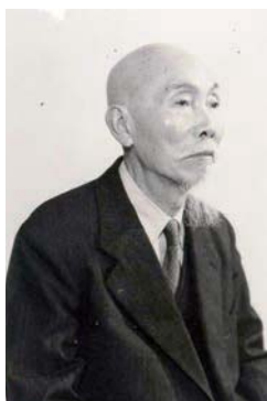
林獻堂先生 ——台灣典藏