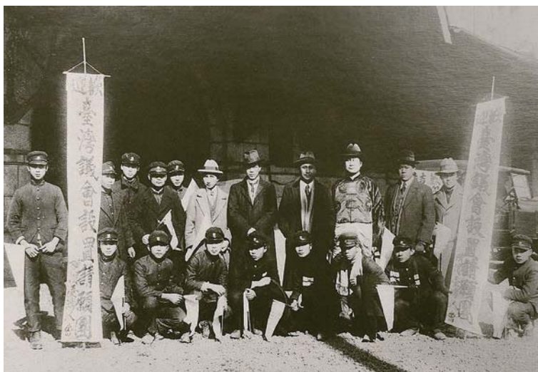
1921.1.30 臺灣人第一次向帝國議會提出「臺灣議會設置請願書」

矢內原忠雄，日本愛媛縣人，生長於富裕的醫師家庭，1910年上京就讀東京第一高校，在學中加入校長新渡戶稻造舉辦