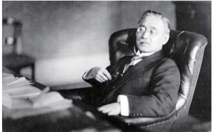
新渡戶稻造——PeoPo 公民新聞

的讀書會。後來考上東京帝國大學之後，又成為新渡戶稻造「殖民政策講座」的學生，同時也加入聖經研究會，終身信仰其所提倡的基督教無教會主義。1920年，任東京帝大經濟部助理教授，同年10月奉派到歐美留學，在倫敦 Toynbee Hall 和倫敦政經學院深造；1923年回國升任教授，並兼任新渡戶教授之「殖民政策講座」教授，因此他的政治及經濟思想受到新渡戶稻造的影響很大。