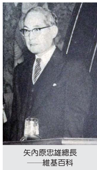
矢內原忠雄總長

矢內原忠雄在台灣友人的安排下，遍訪全島各地，包括臺北、桃園、新竹、臺中、南投、嘉義、臺南、高雄、屏東、宜蘭、花蓮、臺東等地，並深入鄉間探訪民情。他的考察範圍包括工廠、農家、學校、原住民部落等，充分的了解台灣民間的狀況。返回台北之後他應邀在民運活動中公開演講，而受到警察的干涉，然而