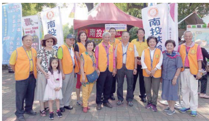
參加反毒宣導活動社友及夫人