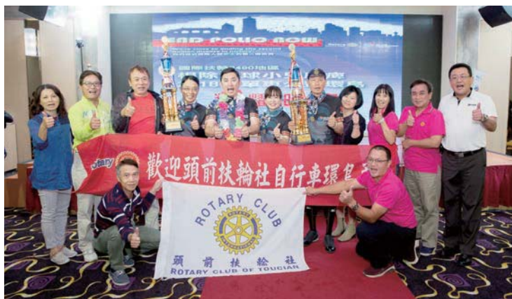
環島勇士凱旋抵達

在這趟旅程中，體會到很多事透過言傳，是無法意會，唯有自己親身經歷，才能領悟到其中的奧妙。