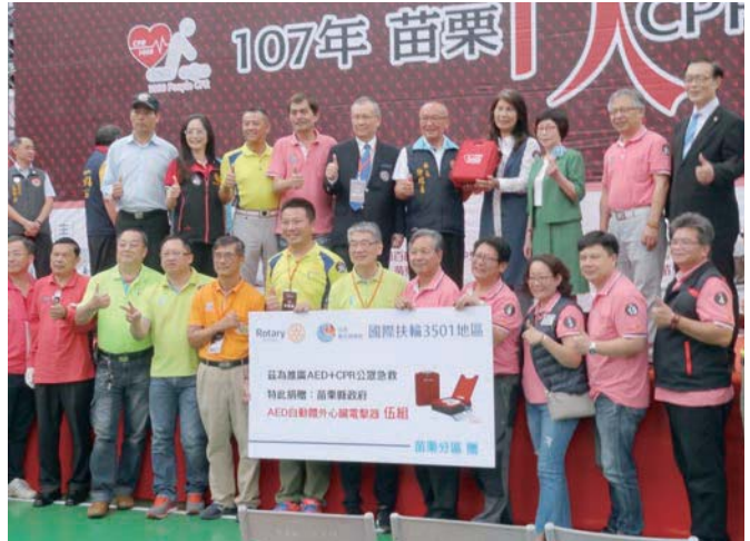
縣長徐耀昌頒發感謝狀後合影

本次訓練採 2015 年衛福部公告之民眾心肺復甦術參考指引，先壓胸 30 下，若施救者不操作人工呼吸，則持續做胸部按壓，直到救護人員至現場接手為止。