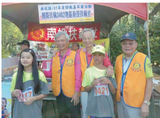
參加反毒活動學生