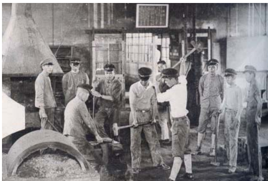
實習工場之照片——開南校史資料

1939年，日本為了發展「南進」政策，而積極培植開拓南洋的工商人才，因此「臺灣商工」即增設「開南商業」、「開南工業」兩所甲種學校，並聘請外籍教師加強英語、馬來語、華語的外語教學，甚至也教授閩南語，以培養更多開拓南洋的實業人才，「開南」之校名即源自於此。