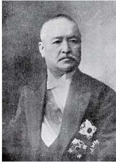
桂太郎——近代名士之面影 第1集