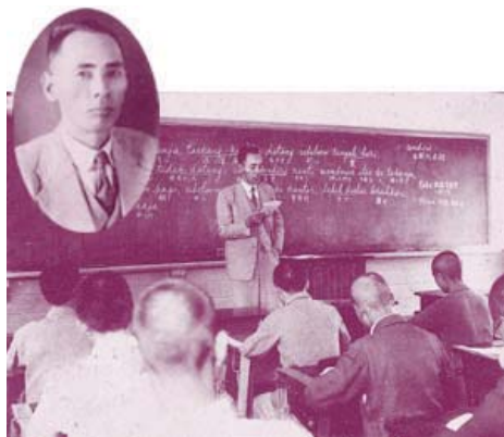
開南商工馬來語教學——校史資料

督府申請經費補助，興建大禮堂兼做風雨操場之用，此後「臺灣商工」的體育發展驚人，達到德、智、體、群、美五育並行的教育。台灣商工屬於民辦型態，可以自由選聘講師，因此所聘任的老師都是業界經驗豐富，具有專業知識的一時之選，不但提升了該校的素質，也受到教育界的矚目。於是佐多萬校長即申請升格為五年制的職業學校獲准。