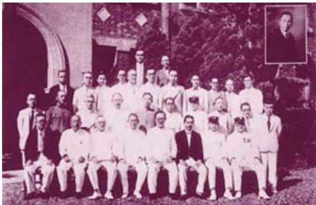
開南商工教職員——開南校史資料