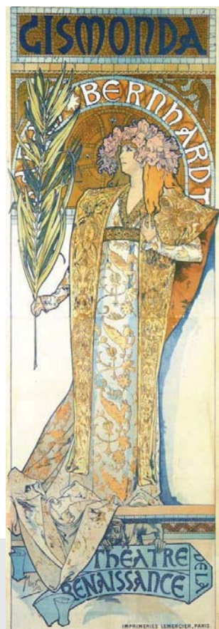
(圖一)《吉斯蒙達》Gismonda (莎拉·貝恩哈特主演) 1894 年

莎拉·貝恩哈特非常欣賞慕夏的才華，請慕夏長期為她的劇場設計舞台、服裝，與海報。也因為長期為劇場工作的機會，慕夏從劇場元素中找到啟發，尤其是劇場人物的肢體語言與炫麗耀眼的舞台服裝，都是形成他筆下如夢一般神秘風格的靈感。