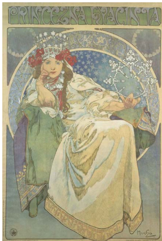
圖六《西雅辛斯公主》1911年

不論人們是讚譽或批評，藝術家一向忠於自己的風格，從34歲獲得畫名伶海報以後得到轉機，他參與了設計史上這一次重要的藝術運動。大從建築型式，小到別針裝飾，我們到處可以看到以花卉圖紋作為設計的主要元素應用，慕夏的華麗設計風格，持續影響到百年後的今天。