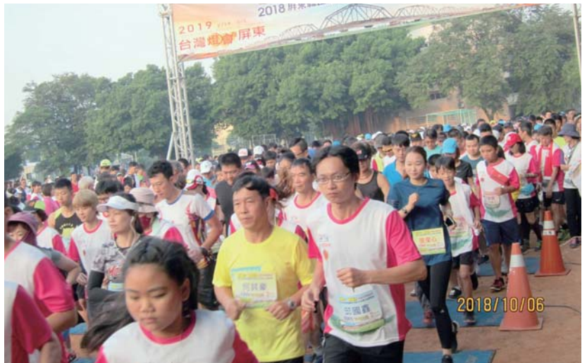
超過 1,500 人響應

本社多年來長期為老人失智症的預防與治療，舉辦各種宣導與講座的活動。今年也聯合屏東縣第三區（百合、東區、南區、溫馨、西區、和平）6個扶輪社一起協助「社團法人屏東縣失智症服務協會」來擴大宣導，並結合屏東縣政府稅務局共同主辦「2018 屏東縣國際失智症日——全國公益路跑賽」，以期使失智症患者及家屬感受到社會大眾的關懷。