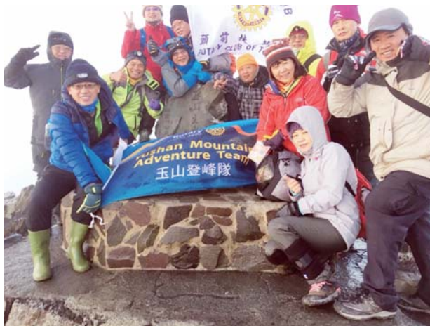
登玉山主峰——頭前活動旗飄揚主峰上

到了代號 00 梯隊員，大家歡笑聲及歡呼聲此起彼落，迴盪山谷。能在玉山相逢興奮之情溢於言表，短暫的寒暄及合照後互道珍重再見，繼續踏上玉山登頂之路。中午到了白木林午餐，簡單的用餐稍事休息後，再度出發，到達了排雲山莊已將屆 17 時，入住排雲安頓好住宿，用餐後，早早睡下。翌日用過早餐，在領隊的帶領下一路縱隊往玉山主峰邁進，在黑暗中靠著頭燈緩緩前進，也不知道爬了多高，在黎明將至，隱約看到遠處透出亮光，內心澎湃興奮無比。征服玉山最後一里路碎石坡後，終於登頂。眼簾之下盡是一片雲海及沒有露臉的金橋