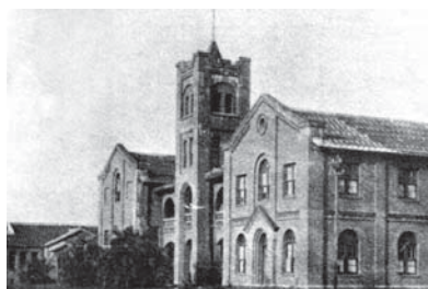
最早的養浩堂醫院 設於台北神學校內