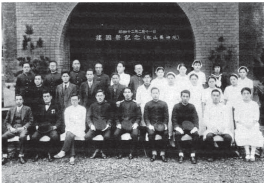
養神院全體教職員合影