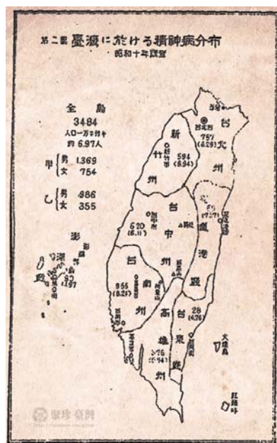
台灣精神病患分布圖

的精神醫學奠定了紮實的根基。此後曾任世界心理衛生聯盟主席，並促成台灣成為全世界八個精神分裂症國際先導研究中心之一。由於他任教台大達 30 年之久，對台灣戰後的精神醫學貢獻卓著，於 2001 年獲得總統府頒贈第一屆總統文化獎及菩提獎。