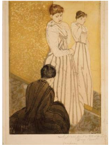
圖十 少女試新裝 1890-91 銅版畫

浮世繪傳遞出了截然不同的創作概念，例如：描寫的大多是民間的小人物、通俗的事物，而非神話、貴族等高高在上的主題。畫面上勾勒著清楚的外輪廓線，以平塗的方式上色，而不刻意以光影的表現手法，營造立體的圖像效果。