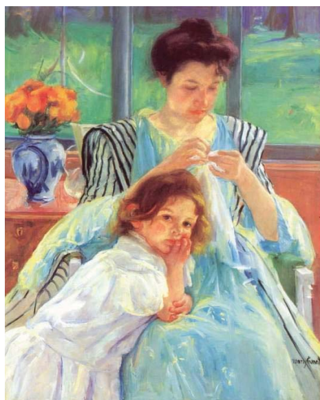
圖七 縫紉中的年輕母親 1900

（圖六）她藉由鏡子中的反射影像，表現印象派當時強調的「光」概念，在畫面上捕捉光線帶來的視覺改變，讓反射在鏡中的人物變得模糊。母親長裙上簡單的幾筆金黃色線條，