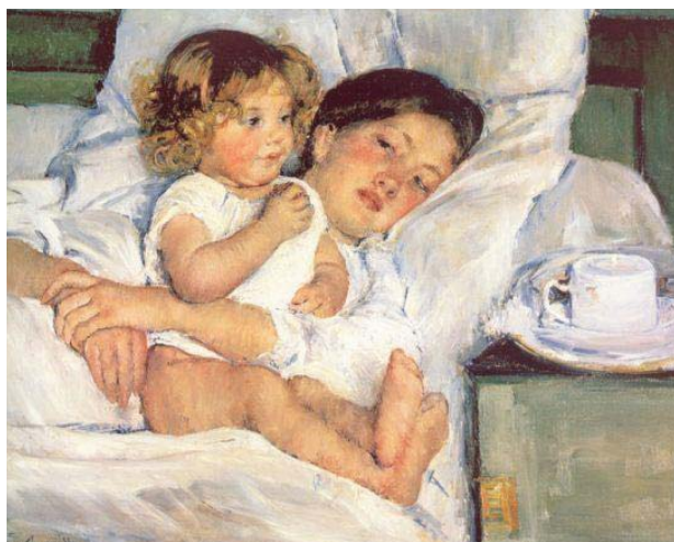
圖四 床上的早餐 1897