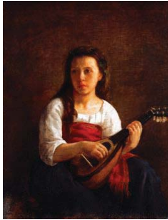
圖二《曼陀鈴琴手》1868 - 沙龍展入選

寶加在畫展中看到了卡莎特的作品，他說：「創作這些畫的人，與我有相同的感受感動。」