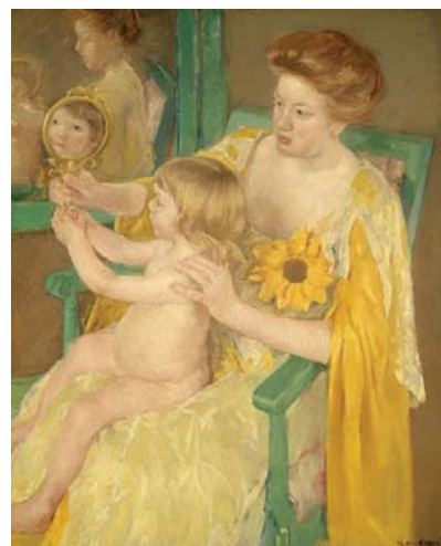
圖六 戴向日葵的母親 1905