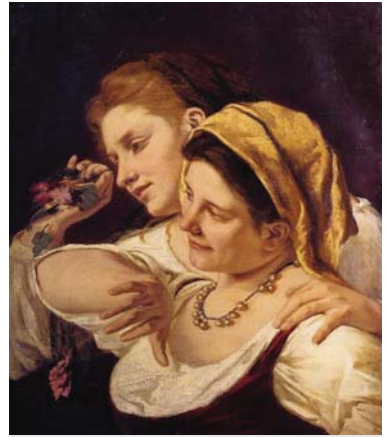
圖三《嘉年華》1872- 法國美展