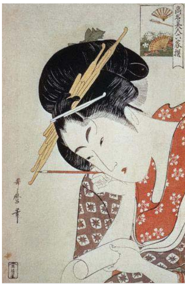
圖八 喜多川哥磨 日本浮世繪

同時期的歐洲繪畫仍然以神話、宗教、政治人物，以及皇宮貴族為題材，藝術家們的最高目標是鍛鍊出栩栩如生的繪畫技巧，試圖在平面的畫布上，以光影技巧，畫出人物景致的立體樣貌，而且色彩大多沉靜濃厚。