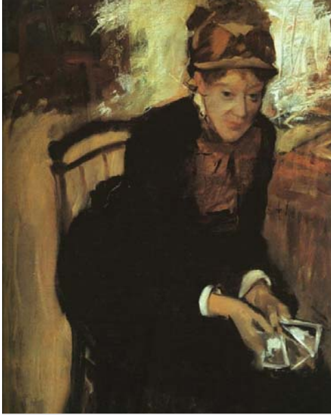
圖一 寶加繪《瑪莉·卡莎特》1880

寶加在畫展中看到了卡莎特的作品，他說：「創作這些畫的人，與我有相同的感受感動。」