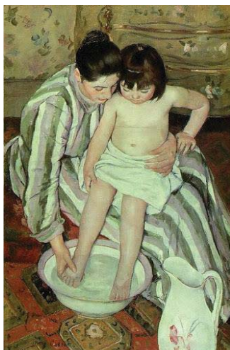
圖五 沐浴的孩童 1880