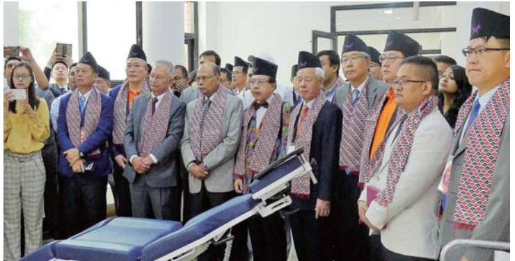
參觀臨床示範特殊牙科治療椅使用情形