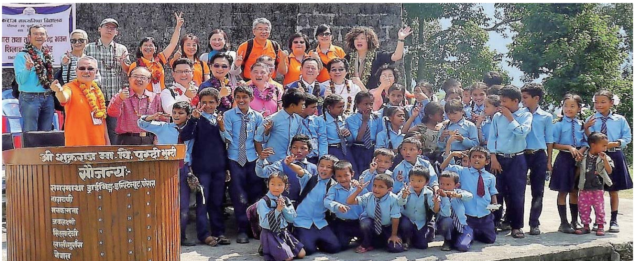
社友與當地學生合影留念