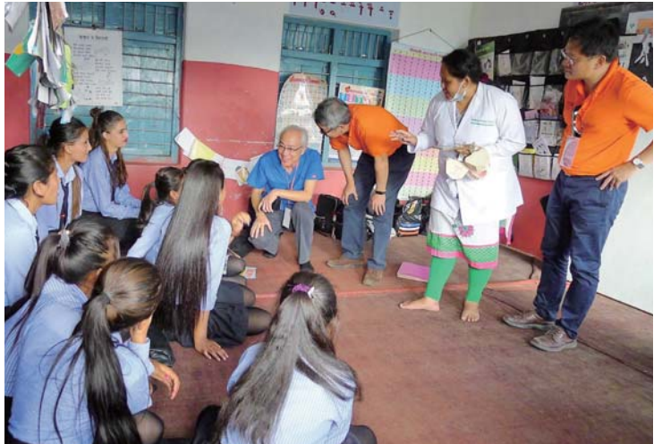
VTT 團員對學生進行口腔衛教