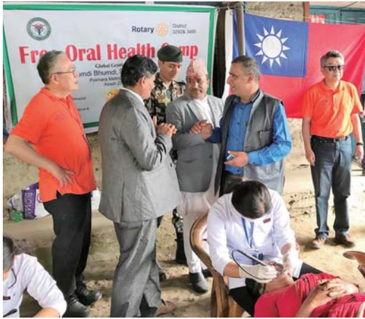
尼泊爾青年部長親臨 out-reach 活動視察移动式治療器材使用情形

輪基金會，進而支持扶輪基金會。個人深信透過“Engage Rotary”蛻變為“Be the Inspiration”必能讓台灣扶輪愛心捐獻與扶輪服務於 2019-20 扶輪年度，Gary 擔任基金會保管委員會主委時，必能再創高峰。