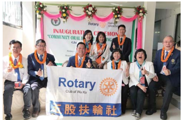
五股社社長率團參與口腔衛生推廣教室揭牌

至於讓扶輪基金捐獻持續成長，唯有讓更多社友認識扶輪基金會與了解扶輪基金會運作，而最好方式便是積極邀請社友參與各項獎助金計畫，不論地區或全球獎助金。因此於鼓勵捐獻時，更應鼓勵各地區、各社積極申請全球獎助金，落實 “Take Action” 而非單純捐獻。