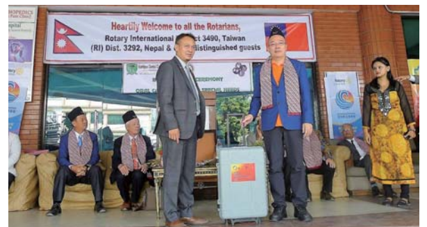
主辦社負責人 PP Spring 代表致贈移動式牙科治療椅

筆者 10 月份擔任由 RID3490 五股社與 RID3292 加德滿都北區社共同合作的 The Oral Health Project (GG1532880) VTT 團長，前往尼泊爾執行「特殊口腔照護中心」、「口腔衛教教室」揭牌儀式、「移動式口腔治療器材捐贈」與偏鄉移動式口腔醫療器械示範暨口腔衛教活動。主辦社五股社方立順社長特別邀請社友、寶眷組團參與這經過兩個扶輪年度才核准的全球獎助金計畫，同時也邀請當時參與現金捐獻他社社友共同前往見證。實地了解善款使用方式，同時感受受惠者的喜悅。經由此方式必能讓社員更認同扶