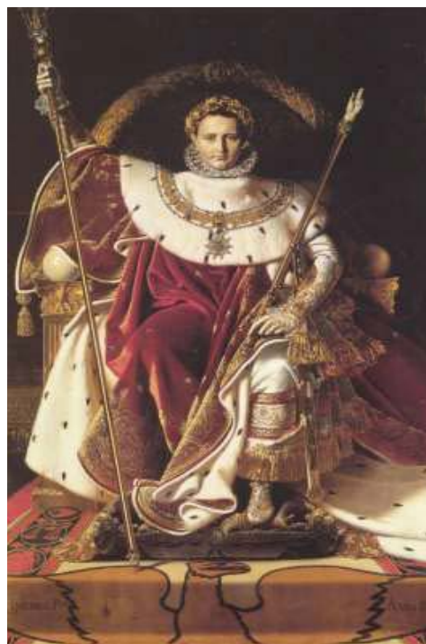
圖 1 〈皇帝寶座上的拿破崙一世〉 1806

安格爾熱愛大自然，非常崇仰文藝復興三傑之一的拉斐爾。但他也知道，如果只是臨摹、學習拉斐爾，自己就很難走出獨特的風格。所以，他從古典的風格中找到一種單純簡約的表現方式，巧妙的將這種純淨的造型美融入於自然，使得他的畫既有古代的典雅，又有符合那時代的新美學觀。