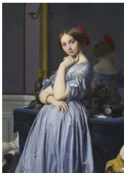
圖 6 〈奧松維爾·露意絲女伯爵〉 1845