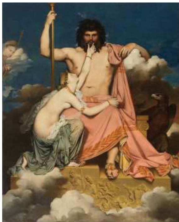
圖3 〈朱比特和特提斯〉1811