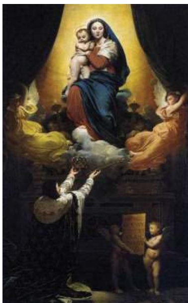
圖 4 〈路易十三的宣示〉 1824