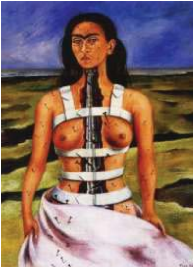
圖十三《破碎的脊柱》1944