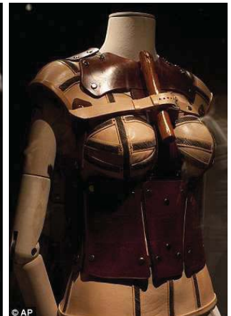
從1953年Frida的驚人假肢，完成了一個紅色的皮平台啟動。

墨西哥這塊土地上，幾百年來印地安族安居生活，而發展出非常淳美質樸的文化，西班牙入侵以後，原有的傳統被歧視和壓制，卡蘿基於對墨西哥文化的自覺，她的傳統就是墨西哥的傳統，終其一生所關注的，就是重新回歸墨西哥的文化根源。