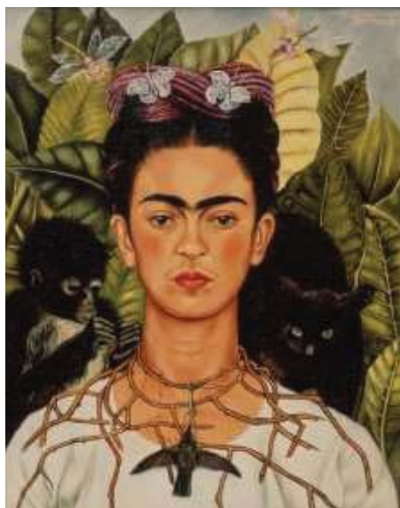
圖十二《戴著荊棘項鍊與蜂鳥的自畫像》1940

信自己的畫有人買，當里維拉以每幅兩百美元第一次為卡羅賣出四張畫，她才信心大起。後來各處畫展的邀約不斷，都是以「畫家」，不再是畫家里維拉妻子的身份應邀，使得她行動與經濟獲得獨立，卡羅自由了。