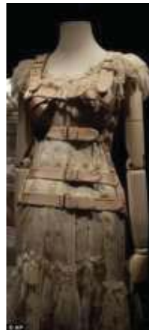
圖十七 Gaultier 從1953年Frida的驚人假肢，完成了一個紅色的皮平台啟動。