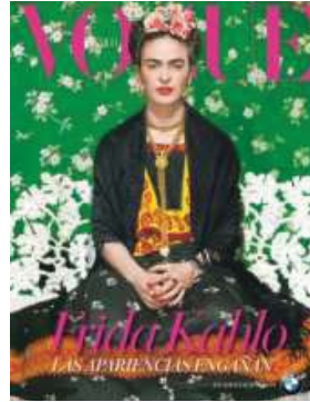
圖十五 VOGUE 1937

以她非常個人風格的容貌裝扮取材的「卡蘿風」，甚至為殘疾設計的輔助、支撐架，都是一種時尚風格的代名詞，近年還成為香奈兒、紀梵希、川九保玲、高蒂耶等這些時尚名家的設計主題。