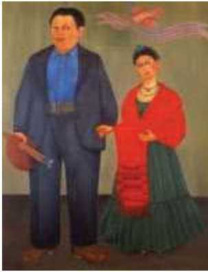
圖四《芙烈達·卡蘿與迪亞哥·里維拉》1931