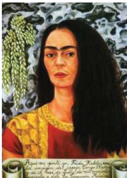
圖十一《散髮自畫像》 1947