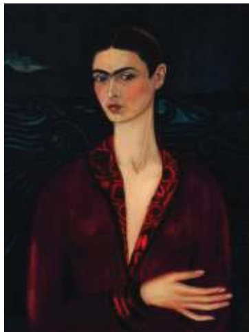
圖二《穿著紅絲絨的自畫像》 1926