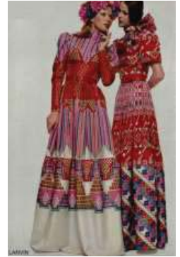
圖十六 LANVIN 1972