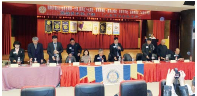
六位社長共同敲鐘

活動特別安排書法名家親臨現場，書寫「扶輪傳愛」春聯，邀請現場參與社友義購，一同為苗栗在地及全台灣的弱勢家庭募集新年紅包，希望在歲末年終之際，送出一份祝福與希望。