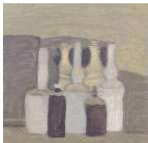
圖四 靜物 1962