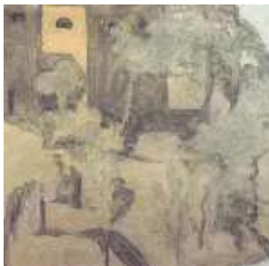
圖九 風景 1962

他畫房子也像瓶子一樣的手法，風景只是簡約的幾何形，一心致力於形狀的簡化與確定，他的均衡構圖、平穩塗色，一練再練。他要將藝術帶到真理的境界，一生遵循自己的創作信念。圖九這張風景，用最簡約的筆觸、造形，以一個黃色作為基調，只靠調入不同層次的灰色，即要交代風景與空間遠近明暗的關係。