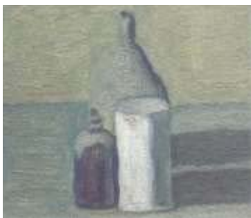
圖二 靜物 1963

起初看到莫朗迪的作品，畫面上幾支單調的瓶子，一點都不特殊的造形，沒有裝飾更沒有設計，灰濛濛的一片，就只是一堆並排的瓶子。這些瓶子一畫再畫，莫朗迪畫了45年，幾乎已經成為他的註冊商標了，除了瓶子數量偶而改變以外，沒有經過繪畫訓練的眼睛，幾乎看不出有什麼大變化，甚至也無法辨識出這就是現代繪畫大師，最具代表性的偉大作品。（圖二、圖三）