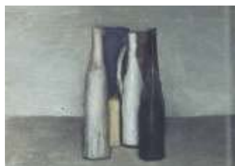
圖六 靜物 1957