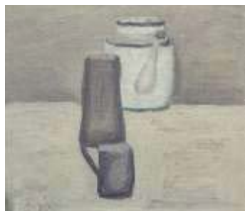
圖五 靜物 1962

他的顏色低沉，偏用濁色的調子，沒有花巧炫麗的繽紛色彩，「畫色與線、形服從於整體和諧的信條，像一個和弦之美」。平淡無奇的幾支瓶子，普通人的眼光也許看都難得看上一眼，但是他在平常物件中發現詩意，感覺神秘。