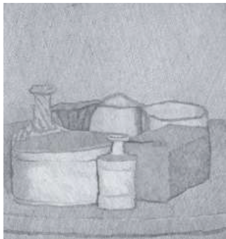
圖十一《四物件、三個瓶的靜物》1961