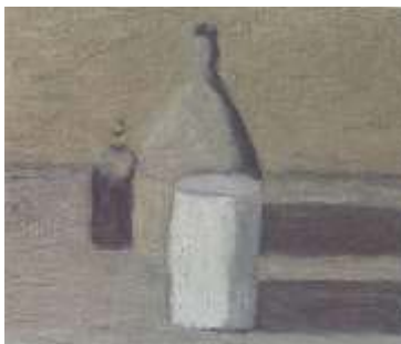
圖三 靜物 1963

有人讚譽莫朗迪是「畫家中的畫家」，但是現代藝術大多數的創作者，多半追求在廣大又複雜的藝術史中，以獨特的技術與題材，提出突破傳統的驚人理念，顯示自己的獨創與才華。莫朗迪卻反而只用一個非常單一的想法，一整個大觀念，貫穿一生所有的創作。