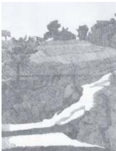
圖十《格里查納的風景》1932

術最大的貢獻是，把大家從沉浸已久的印象派大膽對比的色塊帶開，給藝術一個全新的方向。1934 年波隆納大學藝術史教授羅貝托·隆基對他以下的一番評論，足以證明他的藝術偉大成就：「我終於，並非偶然發現，活著的義大利最好的畫家中的一位，喬吉歐·莫朗迪雖然他今天仍在現代繪畫最危險的乾涸水域中航行，他總是知道如何以審慎的思考、真誠的動力，來引導旅程的方向，他夠得上稱為一個新的領航家。」