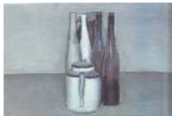
圖七 靜物 1957

一條街上，同一間屋子裡，在自己小小的畫室作畫了幾十年。他終生未娶，也沒有戀愛故事，終生都是跟三個沒結婚妹妹住在一起。每天生活有秩序和規律，不愛變動和攪擾。