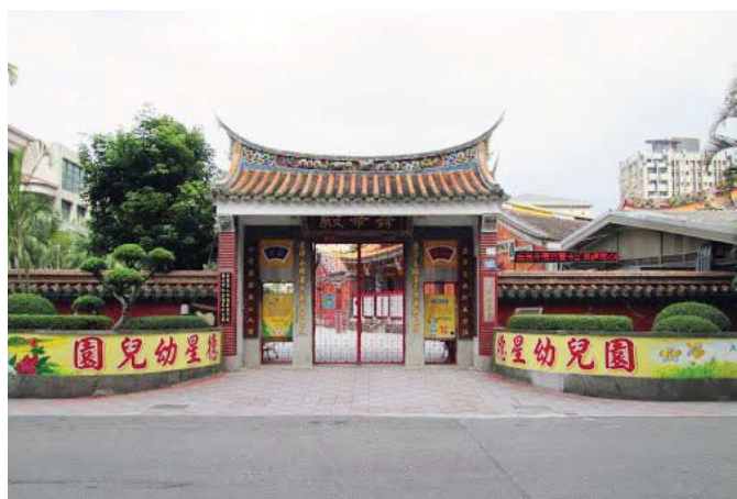
現陳德星堂附設德星幼稚園

此即為日本「保育」名稱的由來。1899年改名為鎌倉小兒保育院。1902年他與妻子同時於基督教鎌倉福音館接受洗禮。