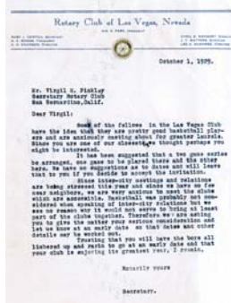
1929 年的一封信，提議 舉行埠際籃球比賽。