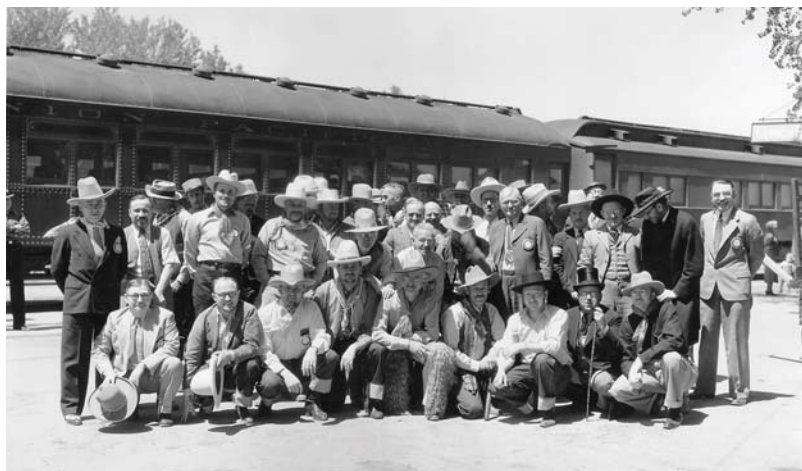
戴著牛仔帽的扶輪社員們慶祝馬術競技週，1938 年