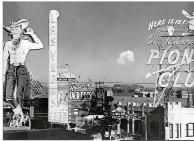
遠處的蕈狀雲象徵 1950 年代的地面核試驗