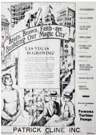
1931 年的摺頁廣告。