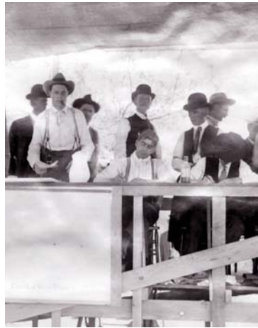
1905 年拍賣市區土地， 該市成立於此一年。