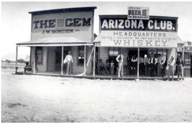
亞利桑納俱樂部，一度曾為該市最佳沙龍。