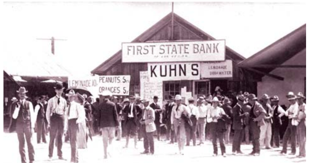
第一國家銀行及昆恩 Kuhn 批發商店，1905 年。