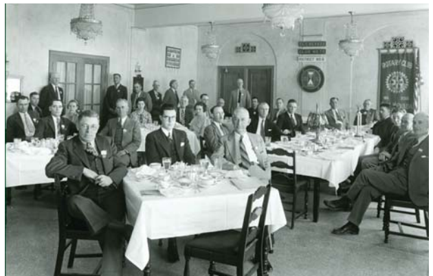
威爾·皮特曼 Vail Pittman (中右)，後來擔任內華達州 州長。