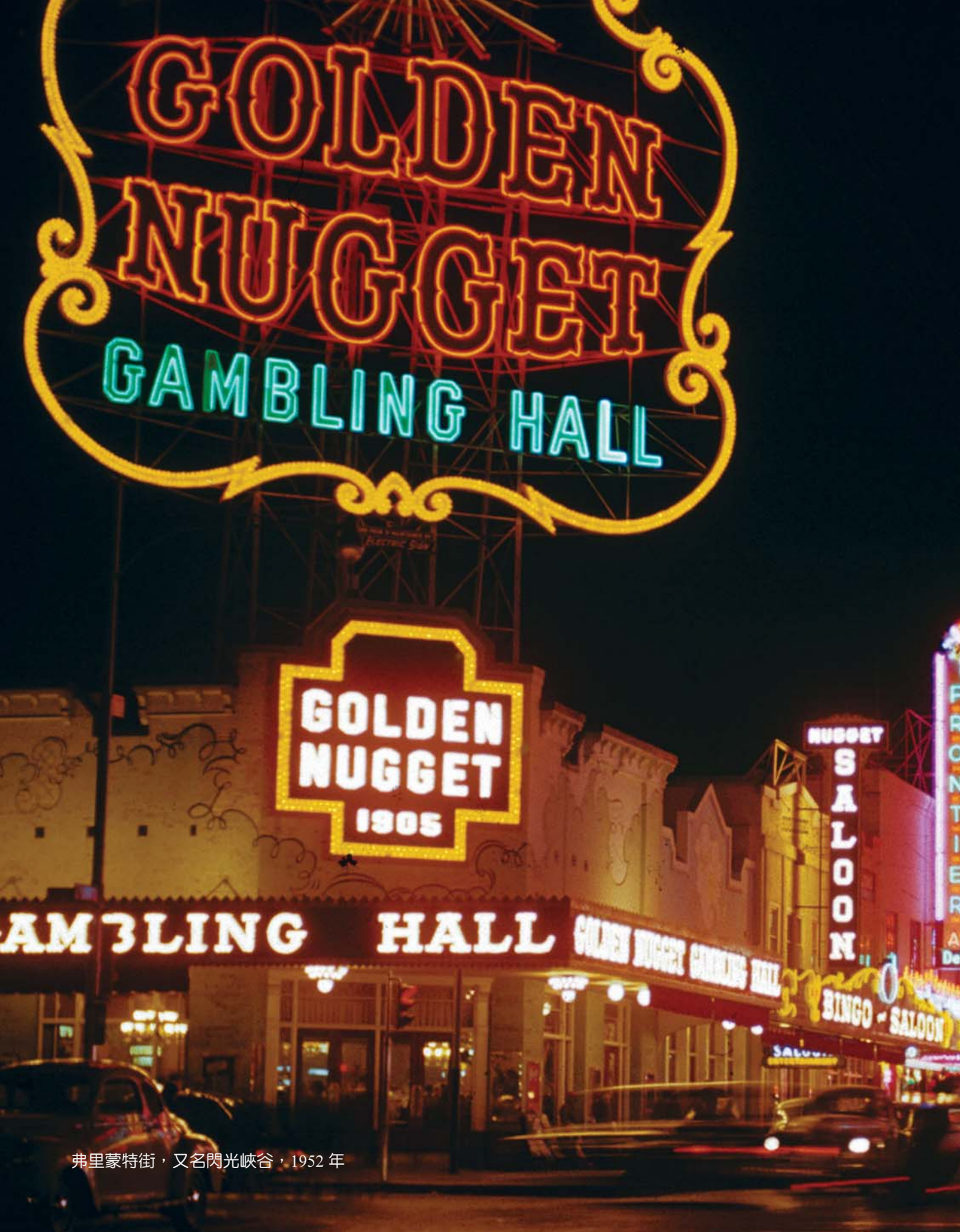
弗里蒙特街，又名閃光峽谷，1952年