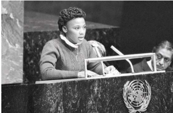
左圖：1968年，年僅5歲的柏妮絲·金恩跟著母親及家人走在父親出殯的送葬隊伍中。右圖：青少年的金恩在聯合國發表演說，呼籲廢除種族隔離政策。

1980年，17歲的金恩便踏上公開演說之路，並代替她母親在聯合國針對種族隔離政策發表演說。大學畢業後，她攻讀研究所取得神學及法律學位，兩相結合對她的使命感與演說技巧產生了巨大的影響，她的演說風格與雄心壯志也讓人聯想起她的父親。