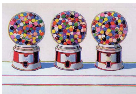
（圖三）三個泡泡糖機，1963