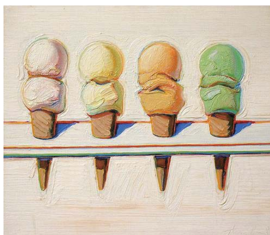
圖七 四個冰淇淋甜筒，1964