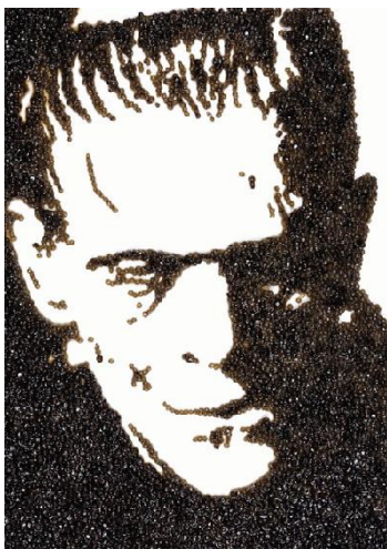
圖七 Frankenstein, from “Pictures of Caviar” ,2004 以魚子醬完成的科學怪人，2004