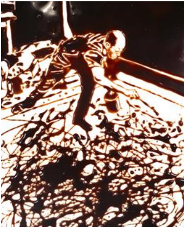
圖二 Action Photo (after Hans Namuth). 巧克力圖像系列作品，「行動攝影 派」，1997