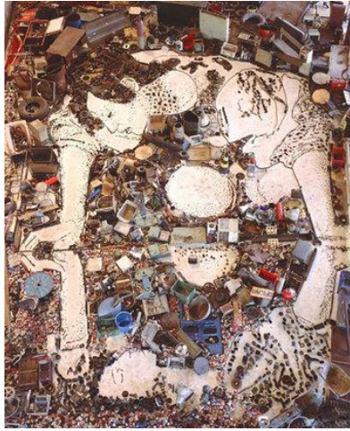
圖九 (Narcissus, after Caravaggio) 以垃圾排列出的作品 《納西斯，於卡拉瓦喬之後》2005