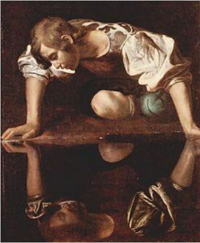
圖八 Narcissus, Caravaggio 1594-96 《納西斯》卡拉瓦喬 1594-96