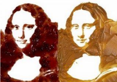
圖三 Double Mona Lisa (Peanut Butter + Jelly)，以花生醬與草莓醬畫出來的 蒙那麗莎，1999

的夢想在這裡破滅、但也有許多人的夢想在這裡實現。在這裡，慕尼茲做過各式各樣奇怪的工作，其中對他影響最大的是在畫框公司上班，他與同事們必須模仿著名的歐洲古畫，以極為寫實的油畫，為公司增加收入。