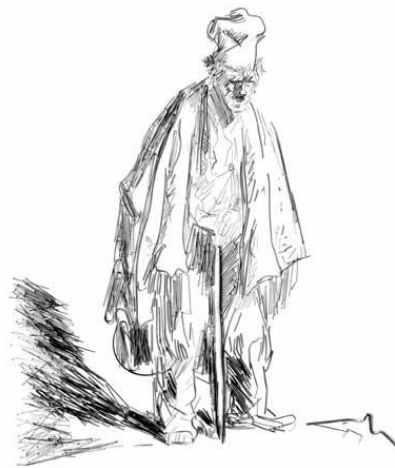
圖五 Beggar I (after Rembrandt), from “beggars,” 2001 乞討者 1 (於林布蘭之後)，2001