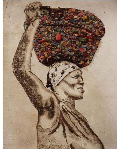
圖十 Waste Land, 廢棄之地 2010

慕尼茲以卡拉瓦喬的畫作為藍本，完成(圖九)攝影作品。他在大型的體育館，高高的站在雲梯頂端，以光筆指揮著地面上的工作人員，大家依照他的指示將垃圾一一定位，構成畫面的垃圾有冷氣機、木製家具、鐵罐、螺絲釘等，林林種種的物品，堆疊成畫中的人物。