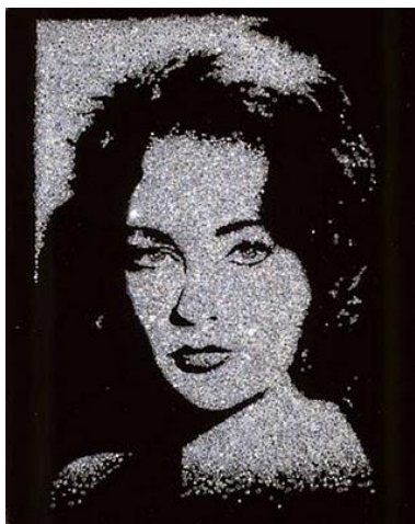
圖六 Elizabeth Taylor, from Pictures of Diamonds,” 2004 慕尼茲以鑽石完成的美國影星伊麗 莎白泰勒的肖像，2004