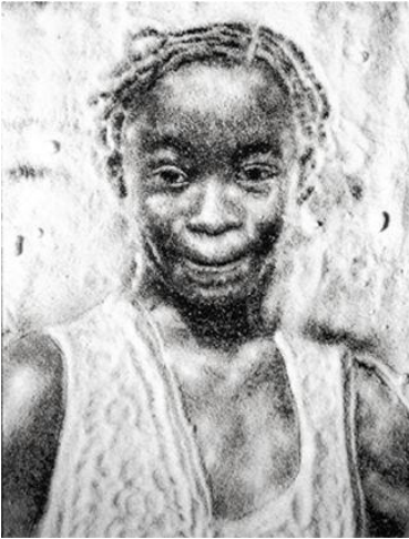
圖一 Valentine, The Fastest. 糖小孩系列作品，1996