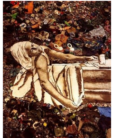
圖十一 Waste Land, 廢棄之地 2010