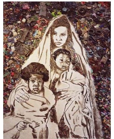
圖十二 Waste Land, 廢棄之地 2010