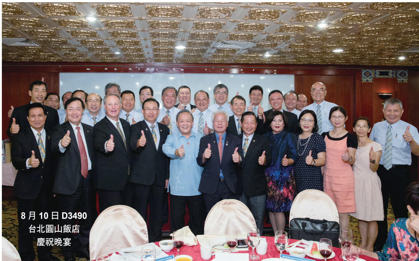
8月10日 D3490 台北圓山飯店 慶祝晚宴