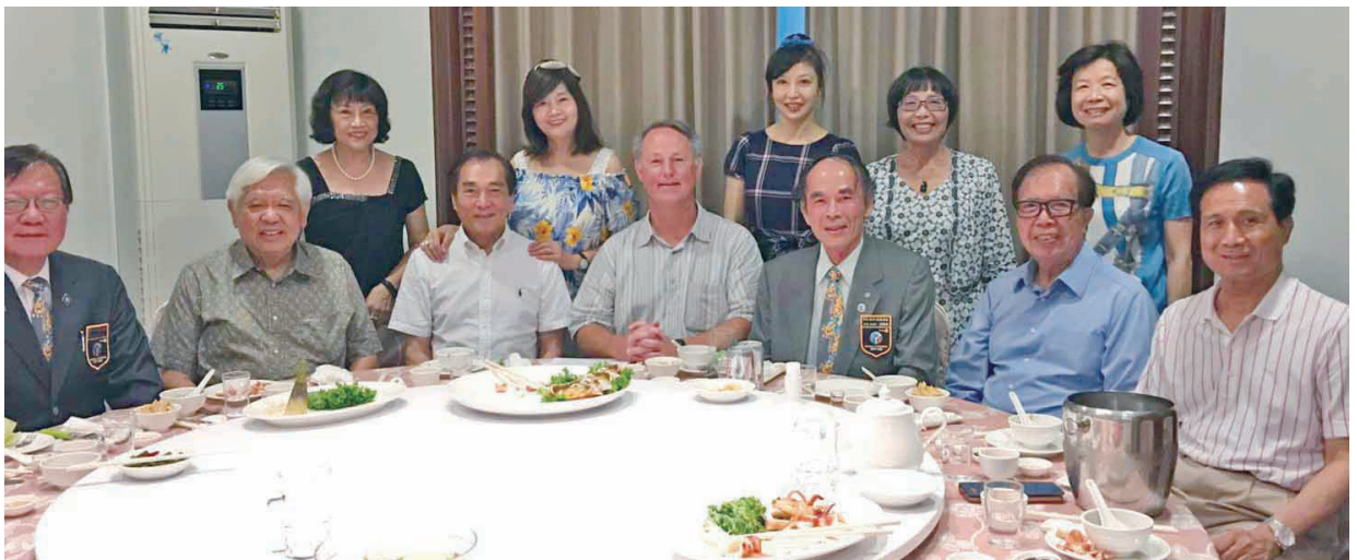
8月13日 D3510 蟬之屋晚餐會