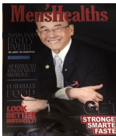
受訪者 PDG Square 登上歐洲健康雜誌

雖然，對上述發展與未來展望，有人仍抱持異議，但是由不同職業，不同種族文化，不同歷史背景並遍佈 120 多國的龐大國際社團，有異議、有矛盾，不足為奇。也許，目前擁有一百多萬社員的國際扶輪不斷地循著先哲黑格爾「矛盾的統一」，而後再「矛盾的統一」週而復始，循此發展軌跡不斷地成長，一代又一代更上一層樓。咱們應持積極、樂觀的看法，參與扶輪的服務與發展。也不禁要大呼一聲：扶輪萬歲，萬萬歲！！