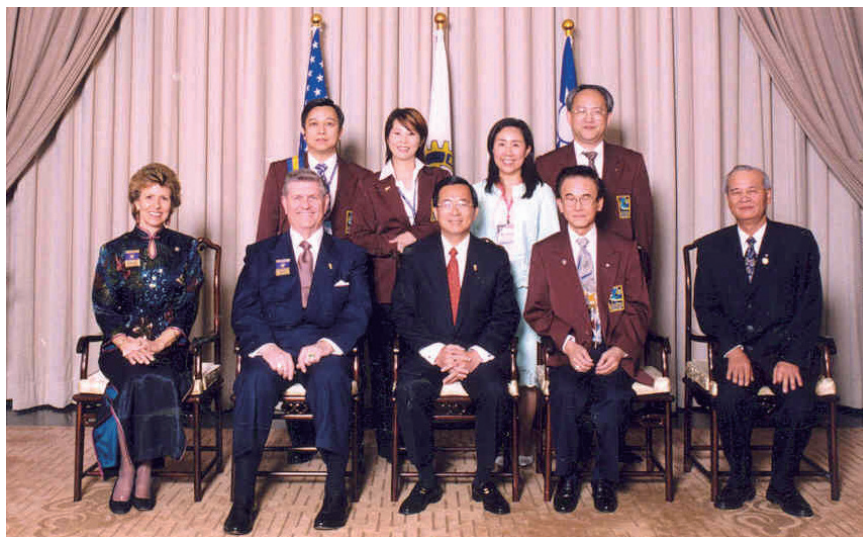
與 RI 社長、陳前總統合影