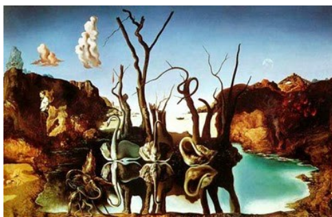
圖 6 1937 年薩爾瓦多·達利《倒影變大象的天鵝》 畫布、油彩，51×77 公分 日內瓦，私人藏品。