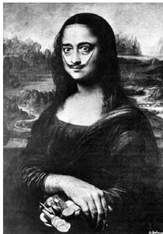
圖 3 1954 年薩爾瓦多·達利《仿蒙娜麗莎自畫像》

論瘋狂，連同輩畫家藝術家都沒得比，達利對自我感覺良好到自大、自戀，甚至到讓人反感的程度。他說：「每天早晨醒來，我都在體驗一次極度的快樂，那就是成為達利的快樂…」看看他的自傳式的書名 1964 五月，「一位天才