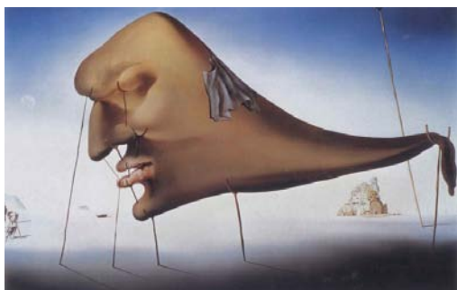
圖 7 1937 年薩爾瓦多·達利《睡眠》 畫布、油彩，51×78 公分 鹿特丹，波依曼·范·柏尼根博物館

美國「太陽報」報導他的畫展說：「很時髦，爭議很多，很艱澀難懂。」不管懂不懂他的藝術，人們接納他，歡迎他，美國是讓達利名利雙收的重要里程碑。達利不脫苛薄本性，在文中談及美國之旅時說：「這裡的人除了有很深的自卑感外，並不瞭解我的畫。使得他們不得不以極大的善意來面對這些現象。他們不像巴黎評論界常有的那種虛偽矯飾，或冷言冷語的狂傲態度。」這一張例圖 7「撐著金叉子虛假臉皮的自畫像」，即是在諷刺時人的愛虛榮，愛面子的虛假矯情。