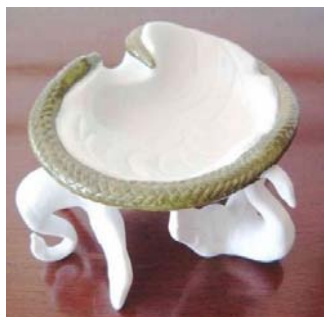
圖 5 1968 年薩爾瓦多·達利，設計印度航空的煙灰缸

達利繪畫寫實技巧非常高明，他畫中的夢境是用拼湊、組合各種離奇的形象和細節，創造了一種真實感，但又是現實生活中根本看不到的離奇景象。