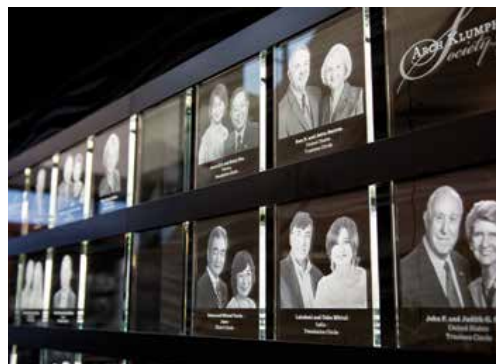
阿奇·柯藍夫會員人數最多國家