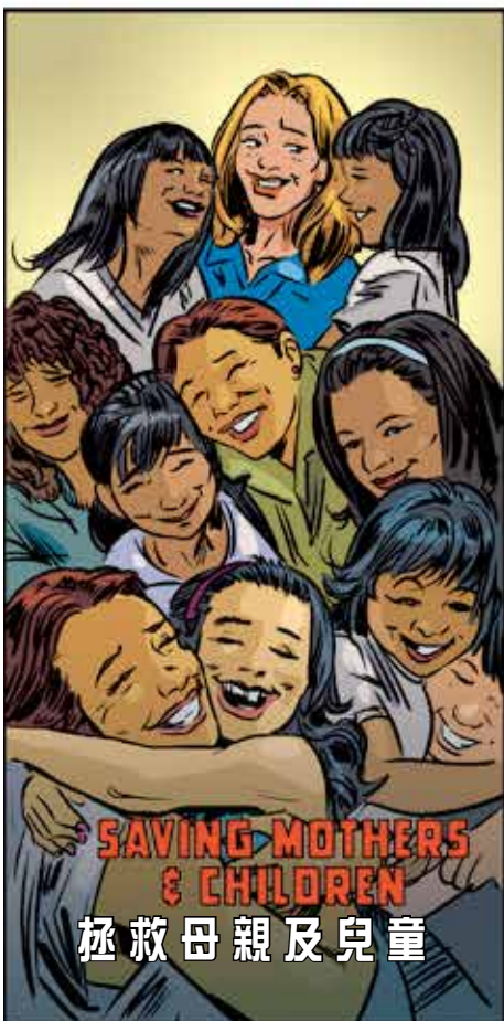
拯救母親及兒童 SAVING MOTHERS & CHILDREN