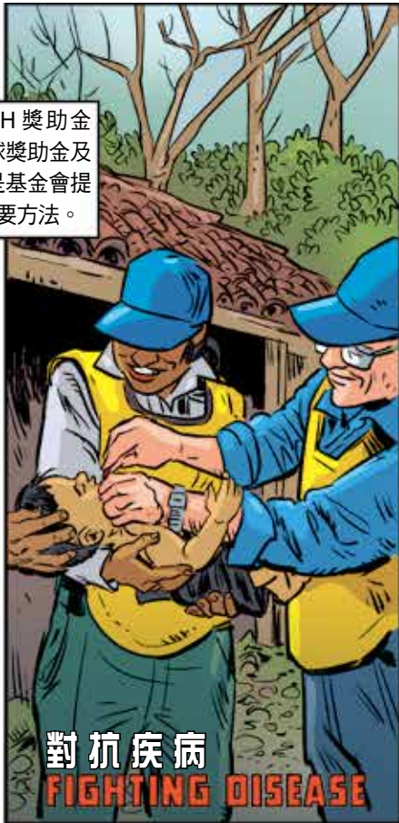
對抗疾病 FIGHTING DISEASE