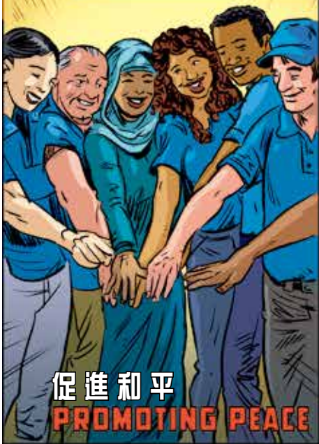
促進和平 PROMOTING PEACE

配合獎助金（1965 年設立）、3-H 獎助金（1978 年設立）、以及接替的全球獎助金及地區獎助金（2013 年設立）一直是基金會提供資金給值得進行的服務工作的主要方法。