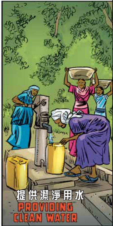
提供潔淨用水 PROVIDING CLEAN WATER