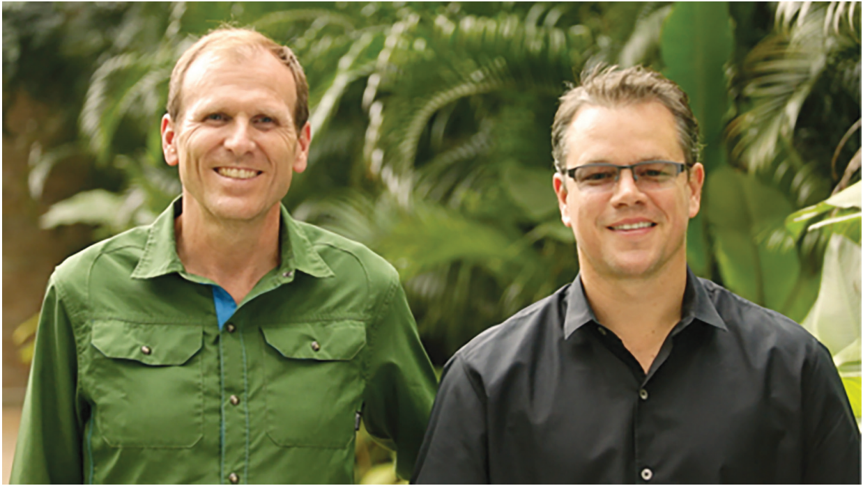
前頁：瓜地馬拉一處公用水龍頭。 上：蓋瑞·懷特（左）在水高峰會發表演說。懷特和演員麥特·戴蒙一起創立「水組織」。

統。懷特說：「給人們確保水安全的資金，就是給予他們想要且需要的尊嚴。」幾乎所有的貸款——平均每筆是 200 美元——都依約償還。