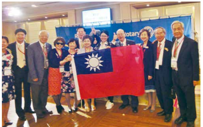
國際場合更顯國旗可愛