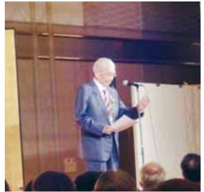
P.D.G Micro 致謝詞