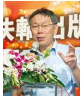
台北市長柯文哲 致詞