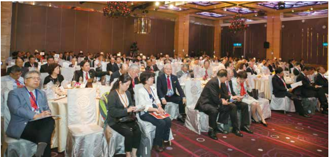
300 多位嘉賓出席盛會