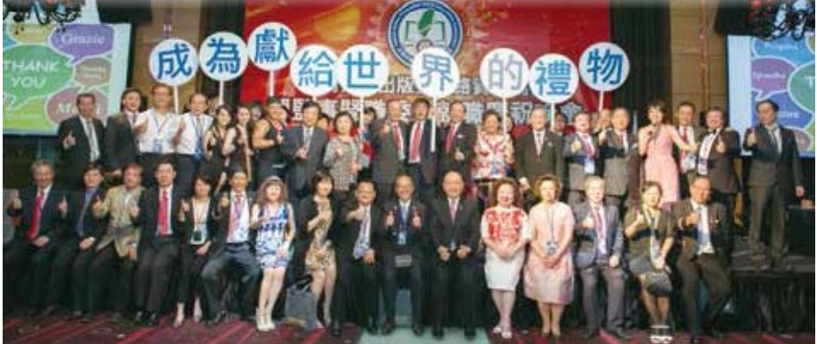
晚會精彩節目表演