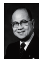
1986-87 M.A.T. Caparas ( 勞工法律事務 ), Rotary Club of Manila, Philippines.